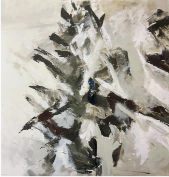
Diptyque, 80x80cm, 2006