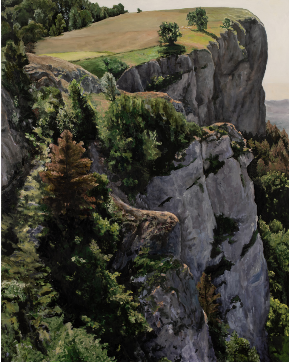
Martin BRUNEAU Belvédère de la roche de Haute-Pierre, 2023 Huile sur toile, 162 x 130 cm