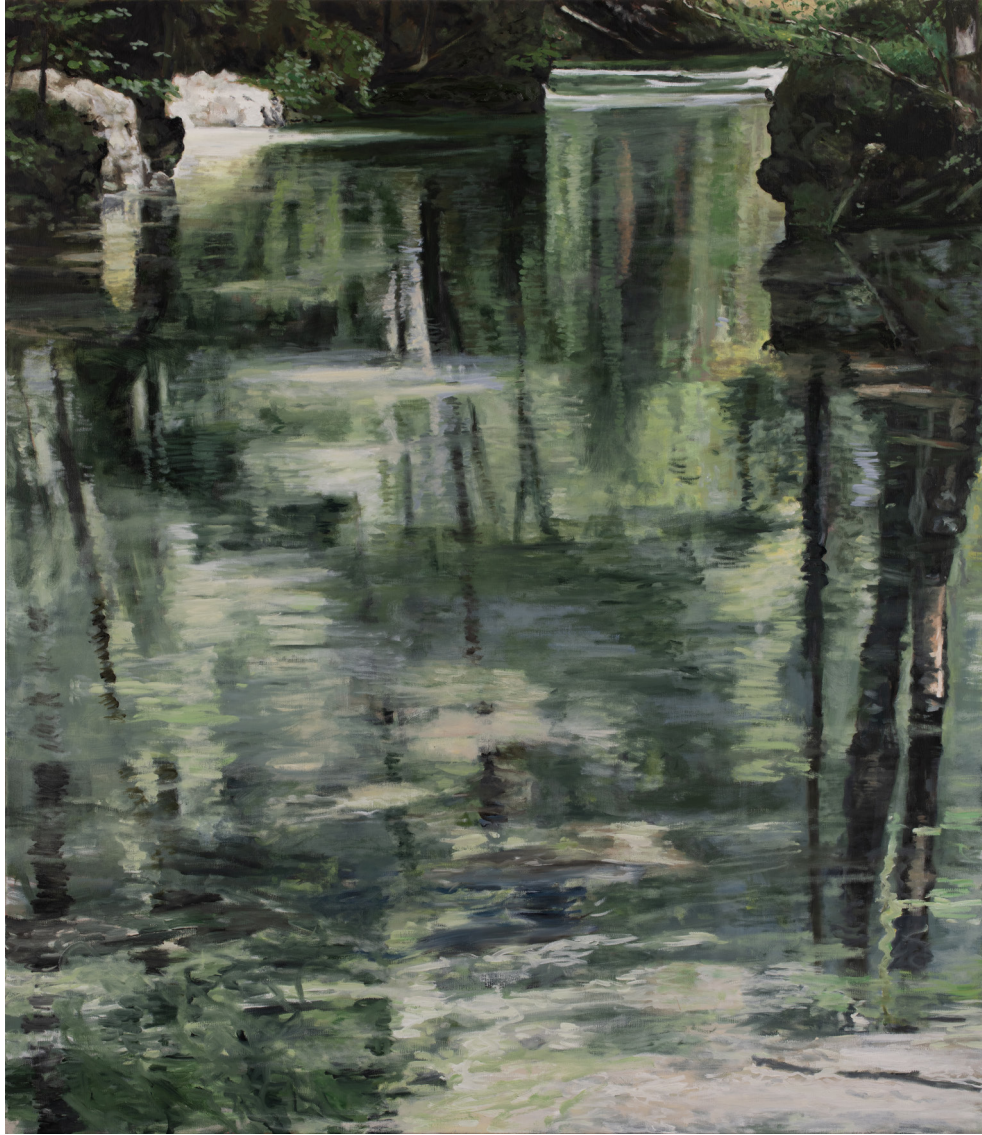
Martin BRUNEAU La Loue , 2023 Huile sur toile, 150 x 130 cm