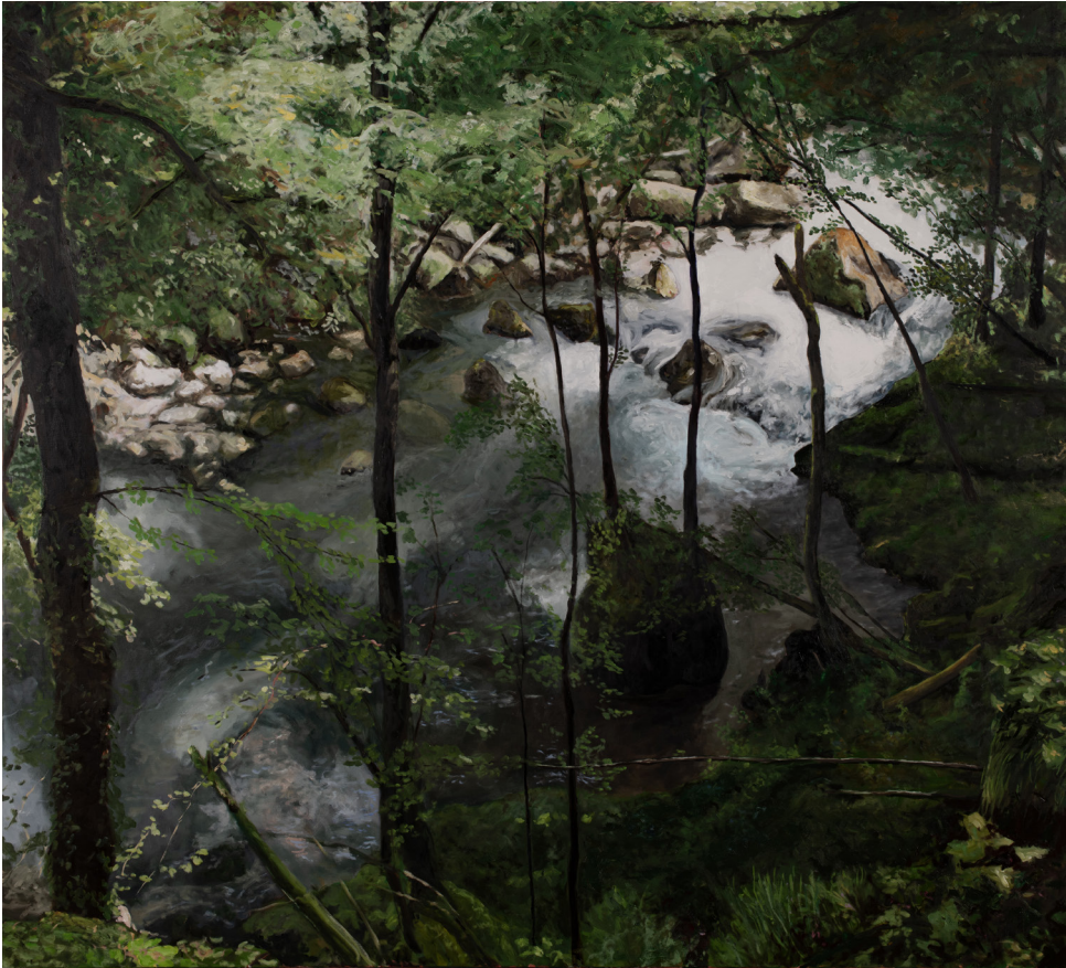
Martin BRUNEAU Rapides de la Loue , 2023 Huile sur toile, 180 x 200 cm