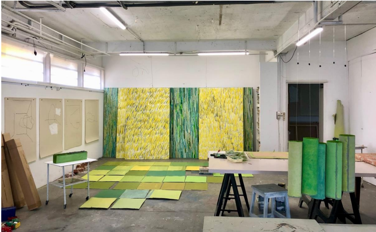
Dans l'atelier, janvier 2023

Site : https://christine.delbecq.free.fr