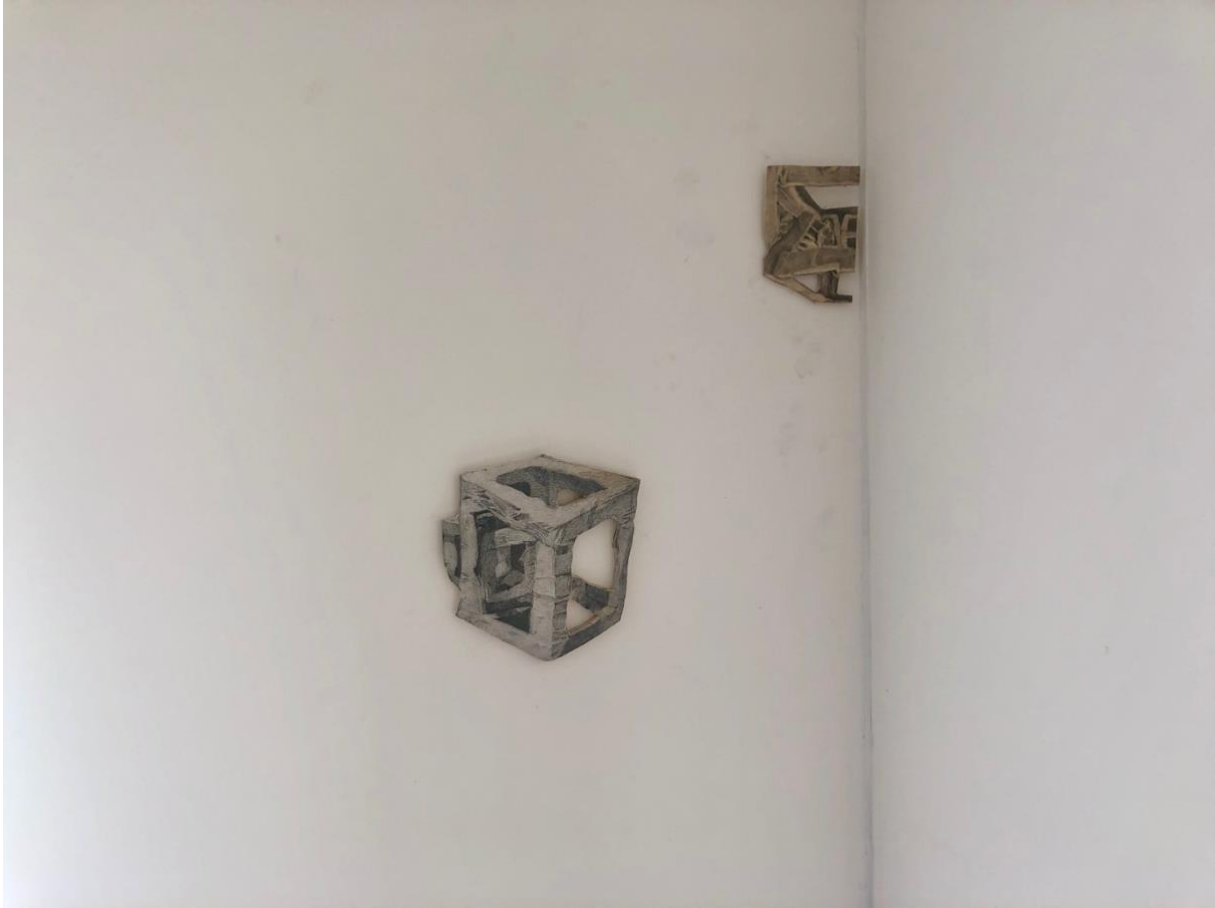
ChaoscartonPetits , espace culturel de Gurgy (Yonne), octobre 2022

Lorsque je travaille à de grandes installations, je dois constamment bouger autour d'elles, mobiliser mon corps pour les réaliser, j'en ai « plein les bras ». Le regardeur percevra l'œuvre de façon plurielle, active, en se déplaçant autour d'elle, sûrement sans s'occuper des détails qui se trouvent noyés dans la masse. Si je travaille en tout petit, c'est mon esprit qui, en adaptant de manière imaginaire ma taille à cet univers réduit, trouve la bonne échelle de regard. En arpentant l'espace autour de l'œuvre, ou en me projetant dans l'espace délimité par l'œuvre, je perçois la dimension monumentale du monde et je la vis, physiquement ou mentalement. Lorsque j'agrandis un détail minuscule pris dans une de mes installations, lorsque je rends visible et hors de proportion quelque chose à quoi on ne faisait pas attention, j'ouvre un nouvel espace, qui confère au fragment un autre sens, ou je dilue une vision identifiée ; c'est une transmutation. En travaillant, je passe constamment d'une échelle à une autre, d'une interprétation (comme pour l'œuvre musicale) à une autre, dans un système d'aller-retour qui se nourrit de lui-même.