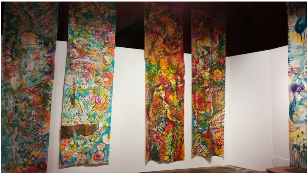
10 œuvres de 1 x 4 m, acrylique sur toile, de 2018 à 2023

Ce jeu joyeux nous permet d'aller plus loin dans notre pratique, d'explorer l'inconnu, en toute confiance, dans une bienveillance et un partage rare. Aujourd'hui, fortes de notre expérience, nous allons plus loin encore, nous nous rapprochons de nos sujets de recherches personnelles, mêlons nos manières différentes de percevoir le monde.