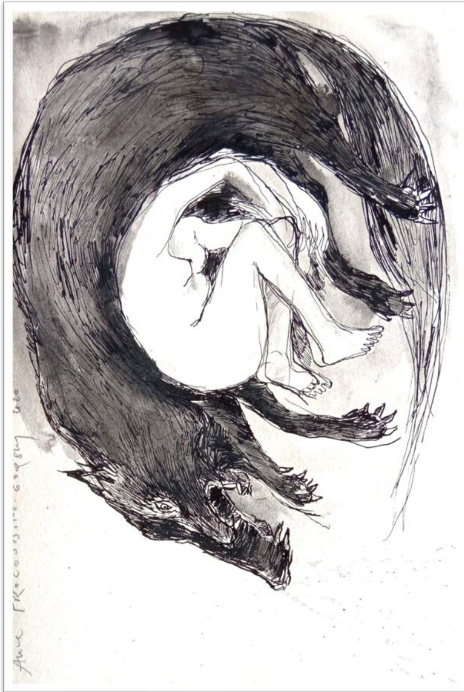
« Loup intérieur » encre sur papier, 21 x 29,7 cm, 2020