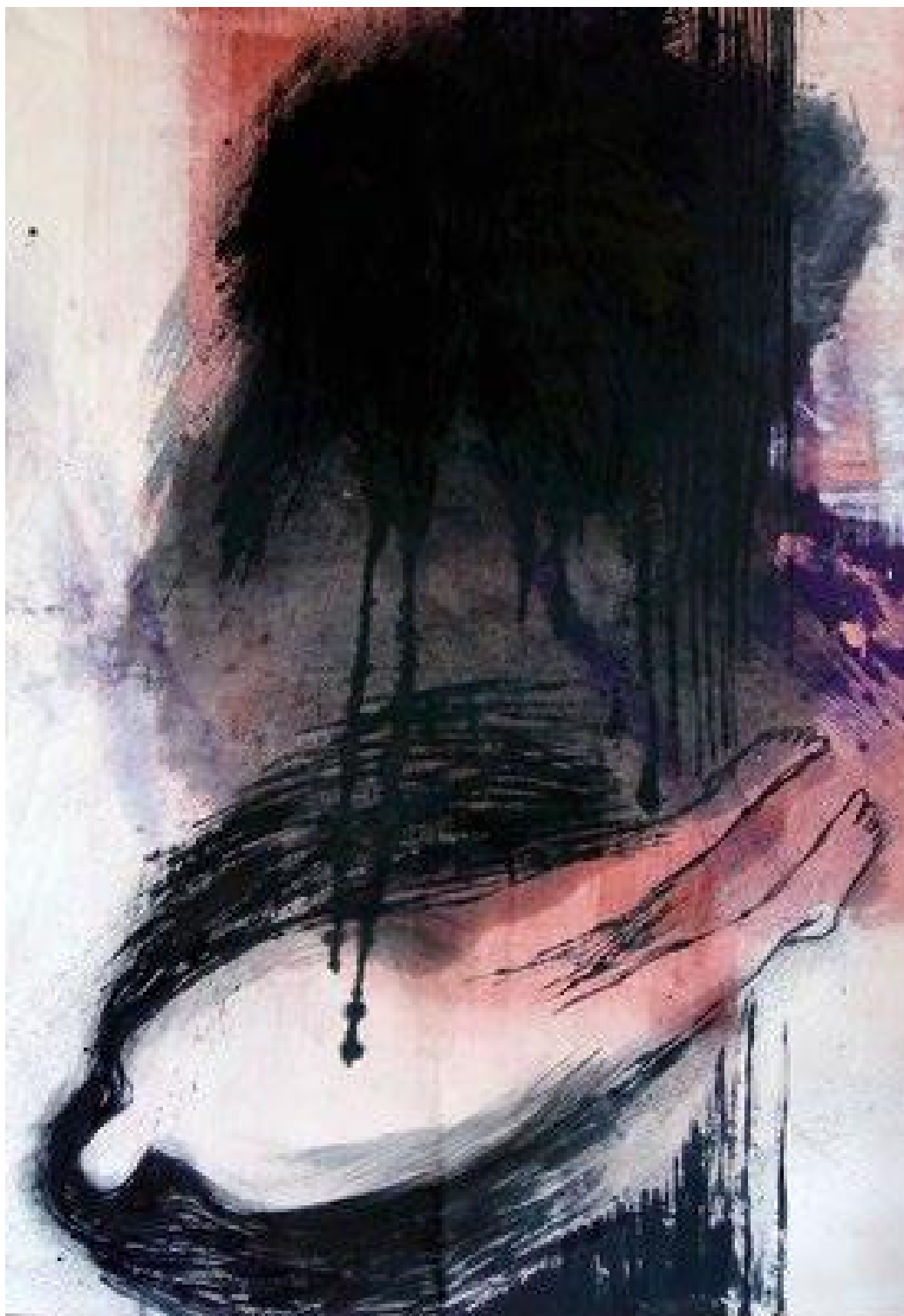
« La Chute » 125 x 200 cm, fusain, pigments, acrylique sur drap de coton