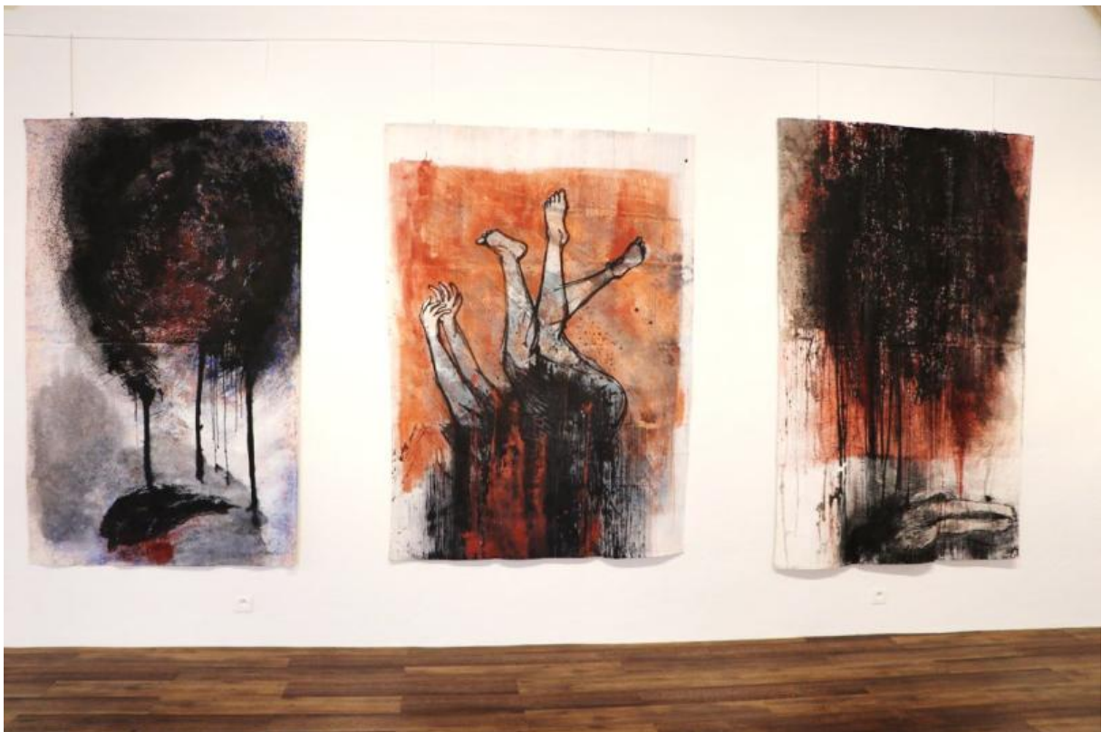
« La Chute » 125 x 200 cm, fusain, pigments, acrylique sur drap de coton 2021