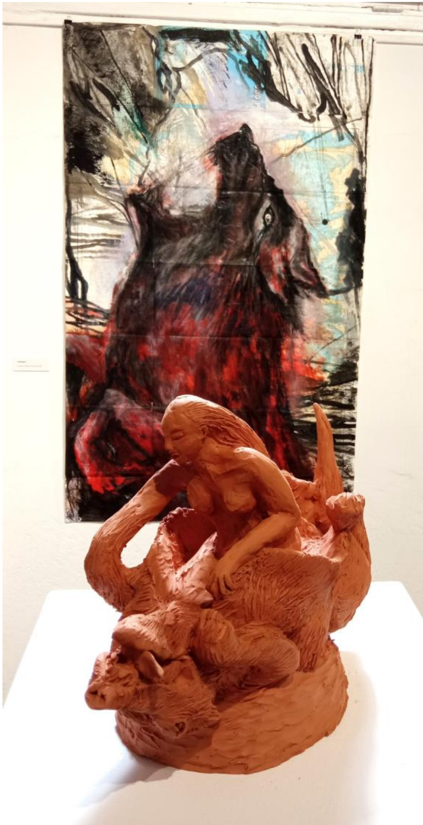
« Renaissance » argile crue 24 x 34 x 16 cm, 2023