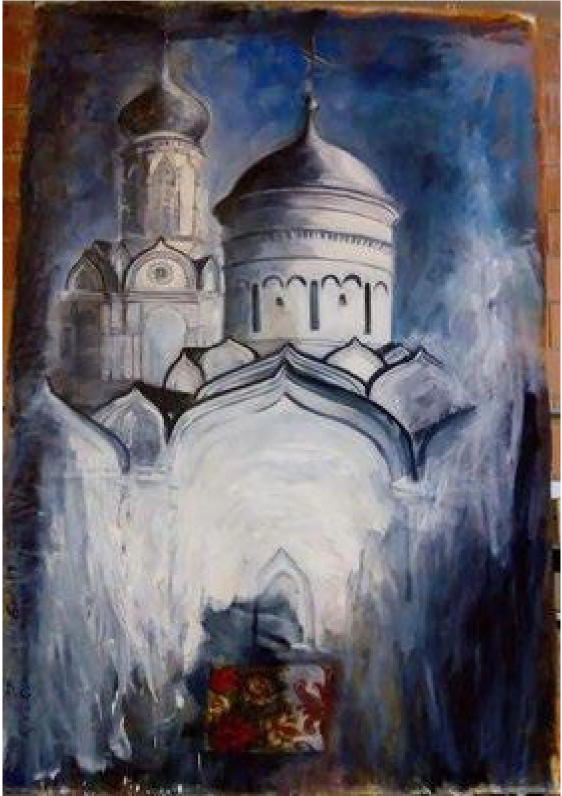
« Les Roses de Kirjatch » 145 x 215 cm, huile sur toile, 2019