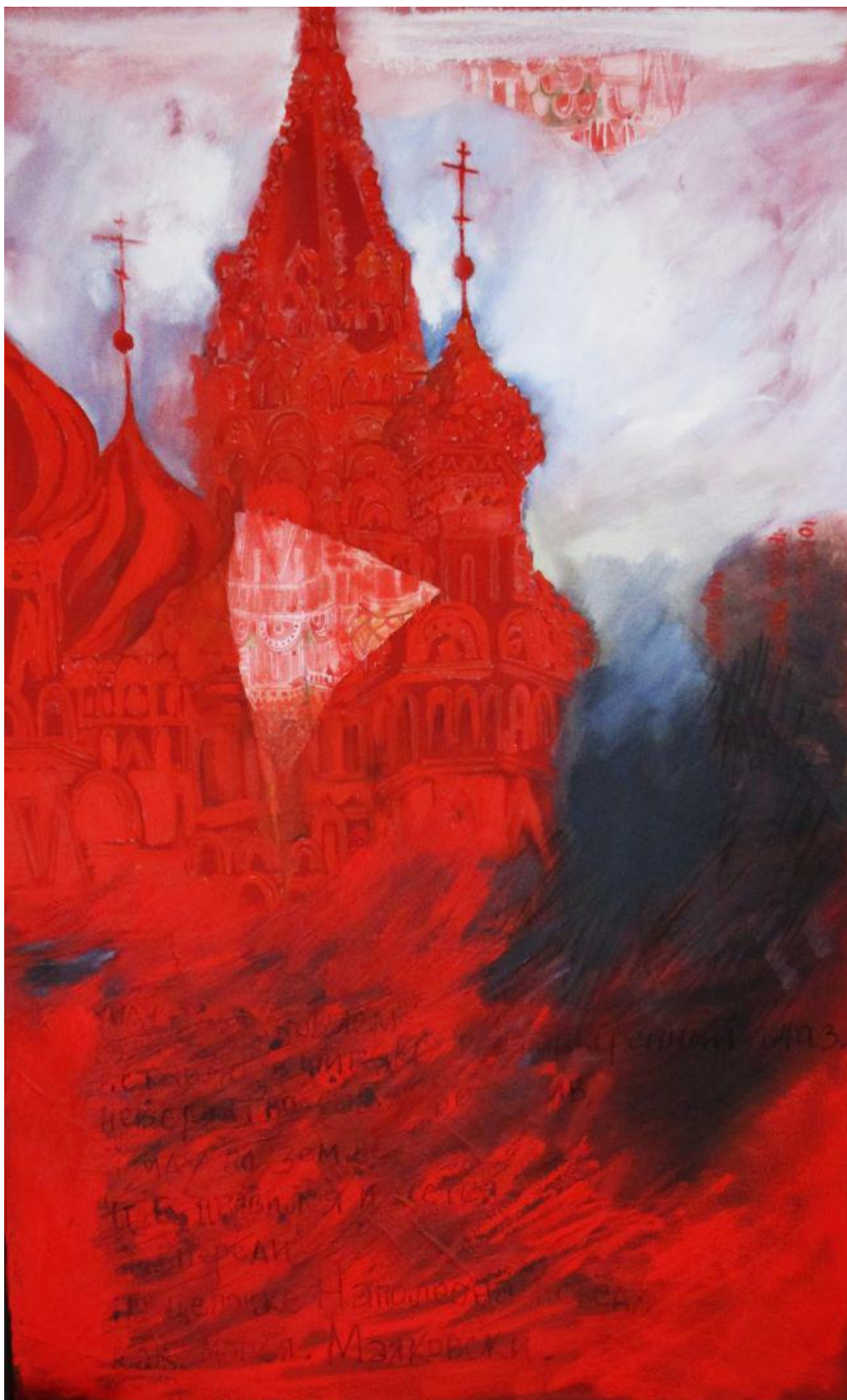
«Le feu de la place rouge » Technique mixte sur toile 2016