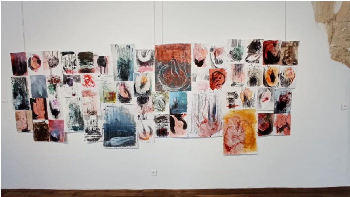
Dessins sur « La Chute » de 2019 à 2021, technique mixte sur papier, 24 x 32 cm, 50 x65 cm