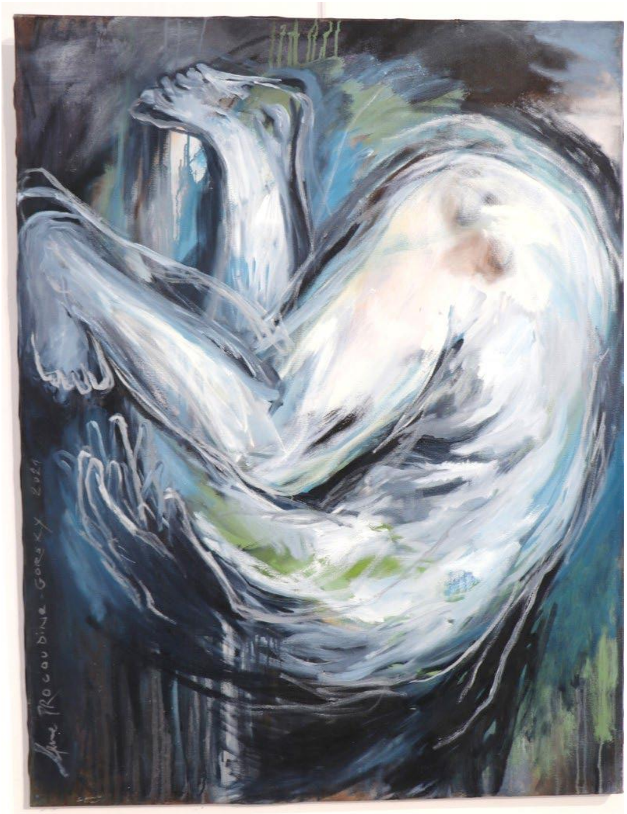
« La Chute » Huile sur toile, 116 x 89 cm, 2021