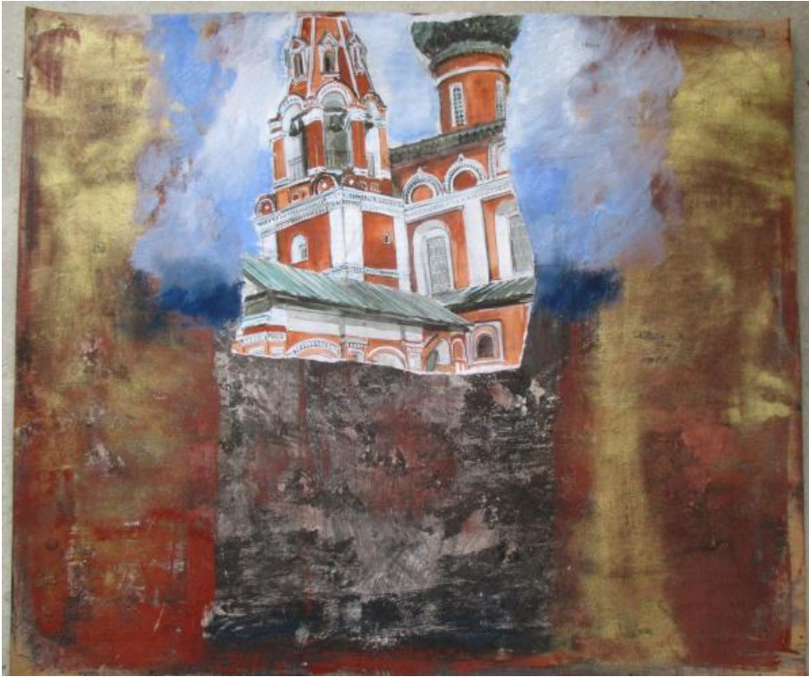
« Eglise rouge » 60 x 80 cm , technique mixte sur carton, 2016