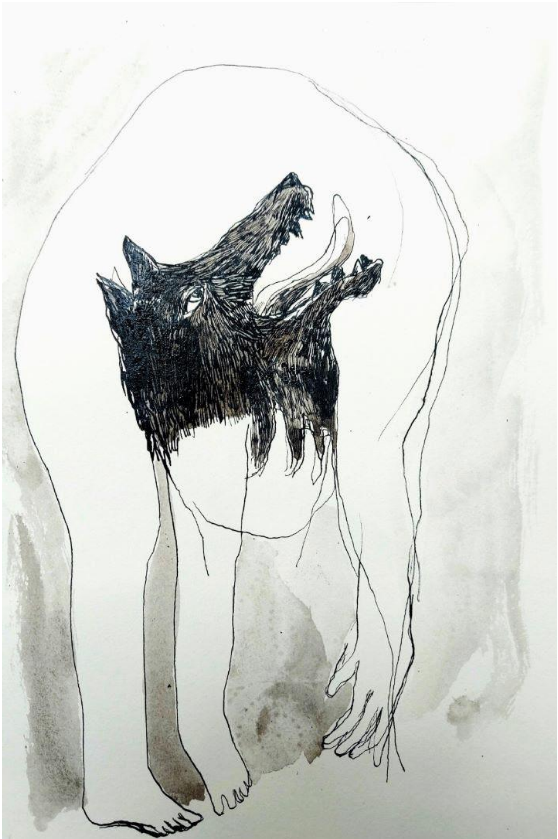
« Dance avec le loup » encre dur papier, 21 x 29,7 cm, 2021