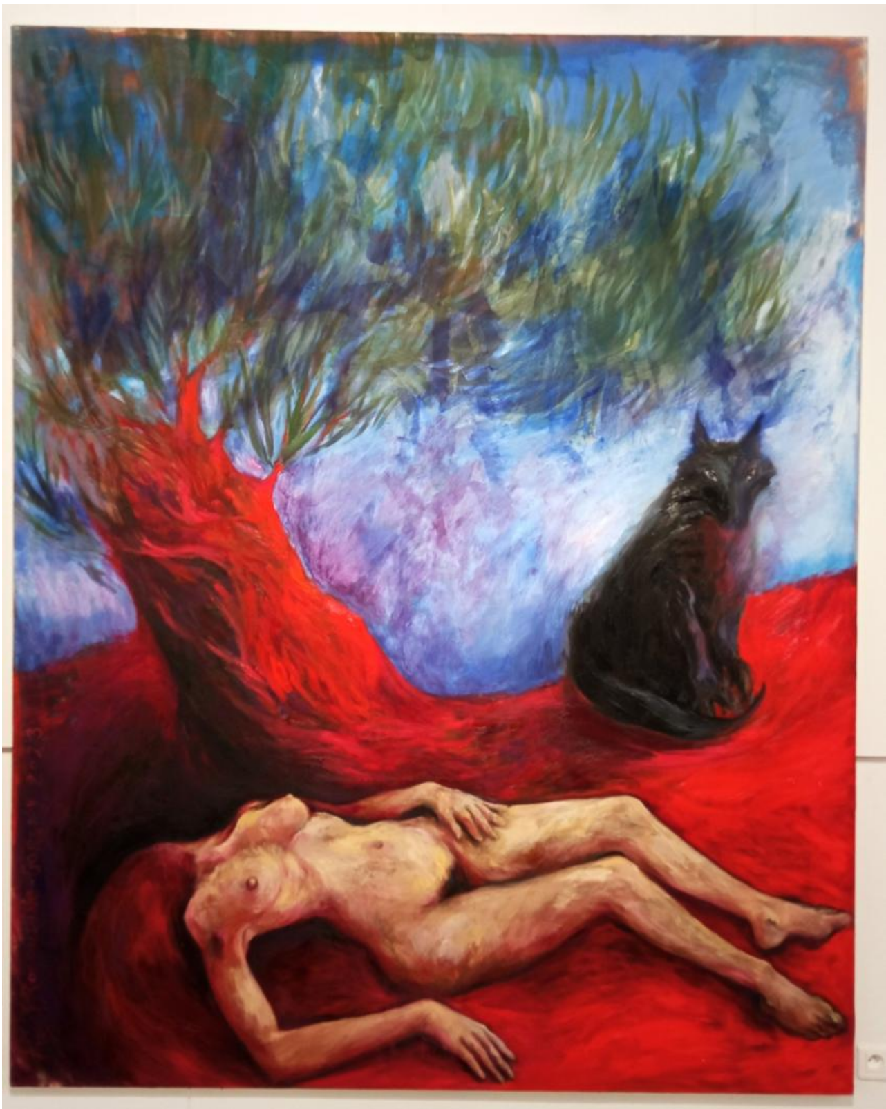
« Sous l'Olivier » huile sur toile, 200 x 265 cm, 2023