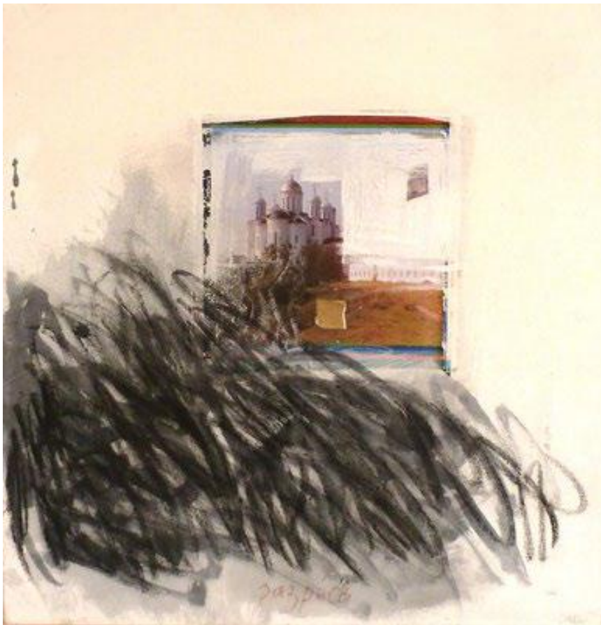
« Songe » 50 x 50 cm, technique mixte sur toile, 2016