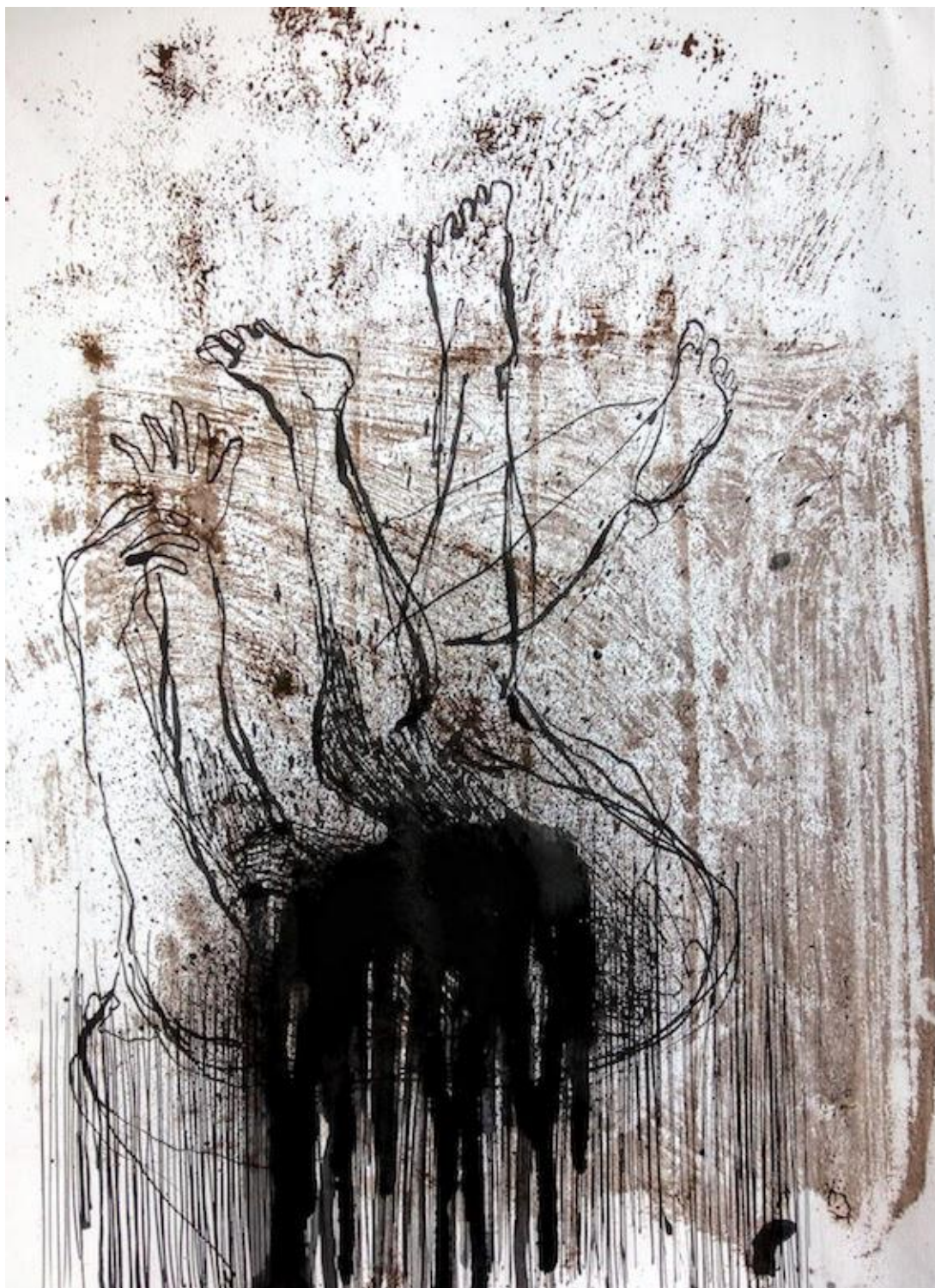
« La chute » encre sur papier 24 x 32 cm, 2020