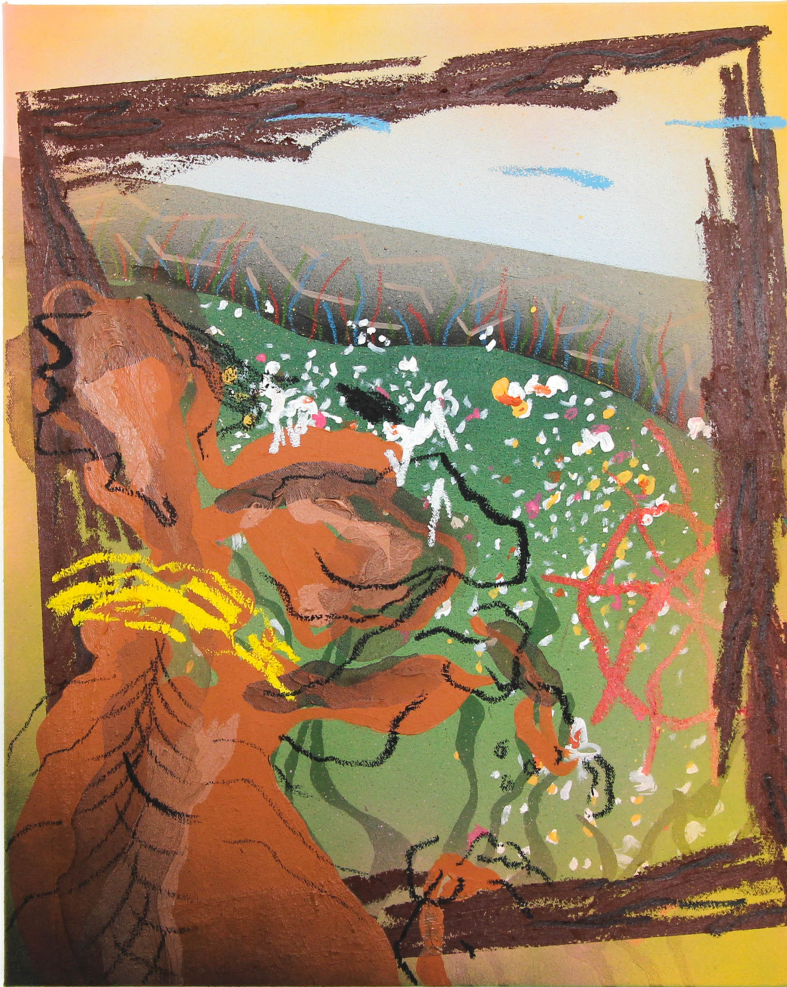
2023, 2023 Acrylique, bâton d'huile, bombe aérosol sur toile 50 x 40 cm