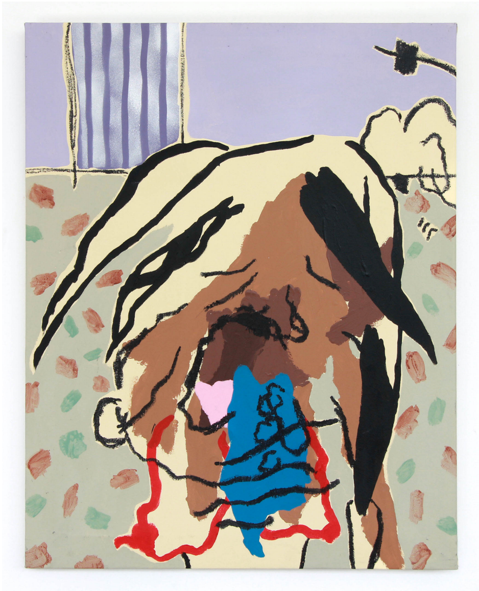
Sfie , 2020 Acrylique bombe de peinture et bâton d'huile sur toile, 90 x 75 cm