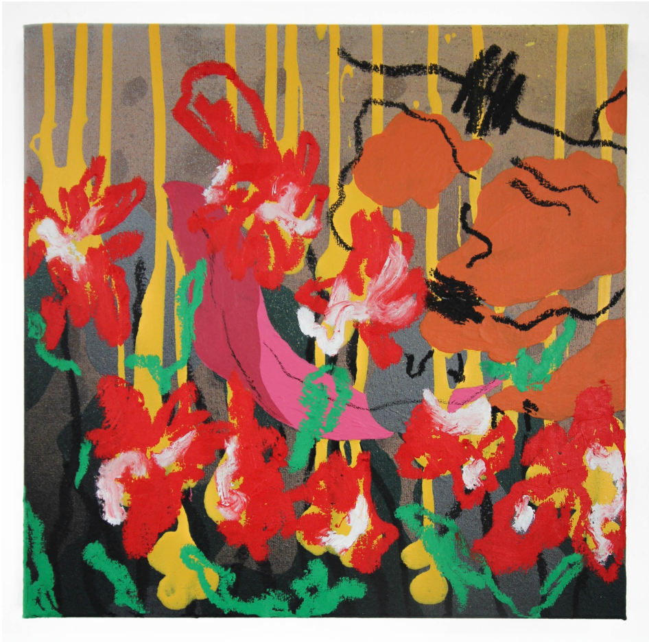
Ondine aux fleurs , 2022

Acrylique, bombe aérosol, bâton d'huile sur toile 30 x 30