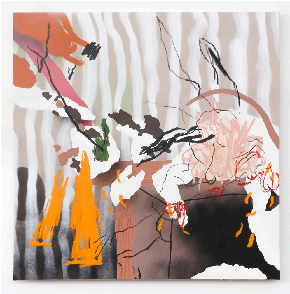
Contact, 2022 Acrylique, bâton d'huile, bombe de peinture sur toile 101 x 101cm