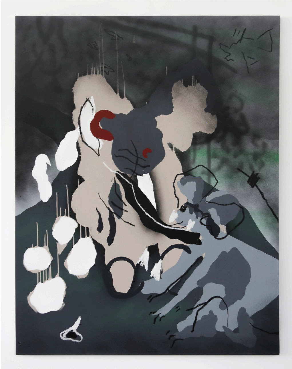
10/12/20 , 2022 Acrylique, bâton d'huile, bombe de peinture sur toile 180 x 141cm