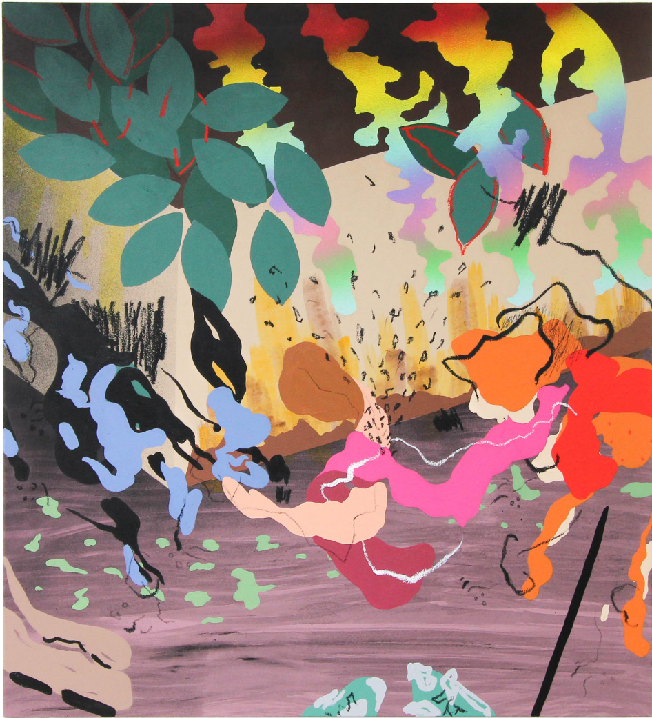
21/12/2022, 2023 Acrylique, aérosol, bâton d'huile sur toile 100 x 83 cm