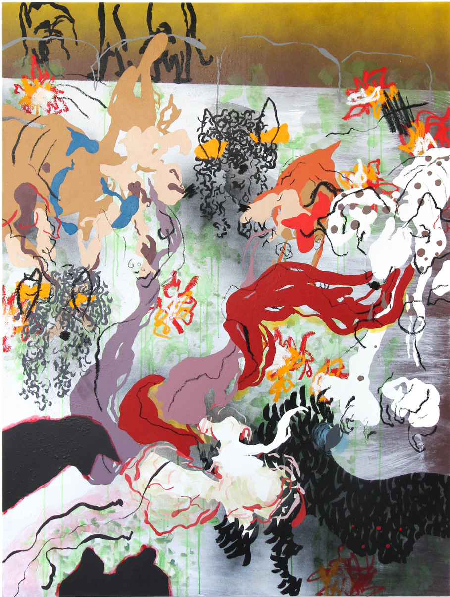
18/01/2023, 2023 Acrylique, aérosol, bâton d'huile sur toile 160 x 120 cm