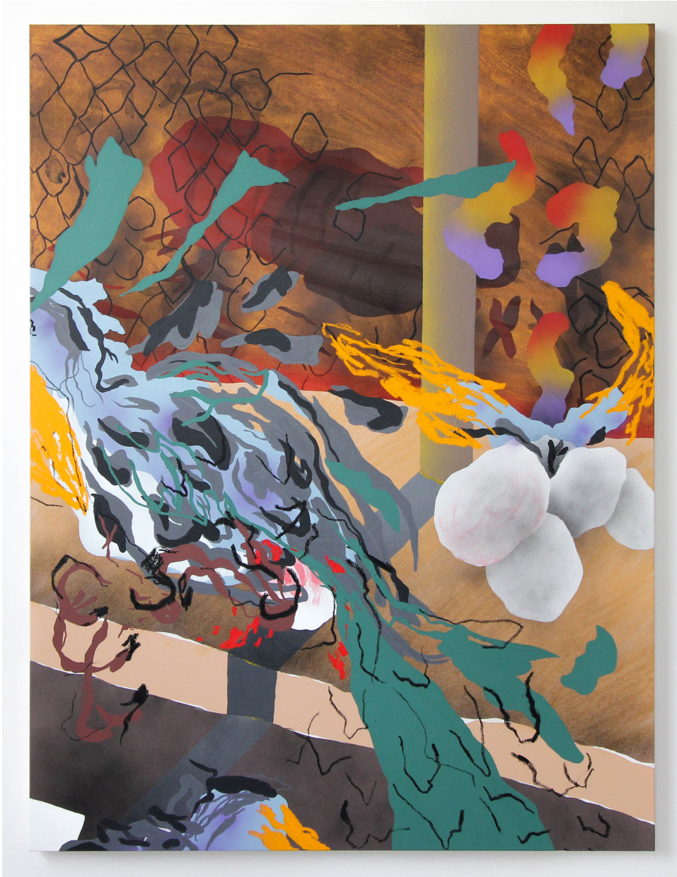
20/02/2023 , 2023 Acrylique, bâton d'huile, bombe aérosol sur toile 160 x 120 cm