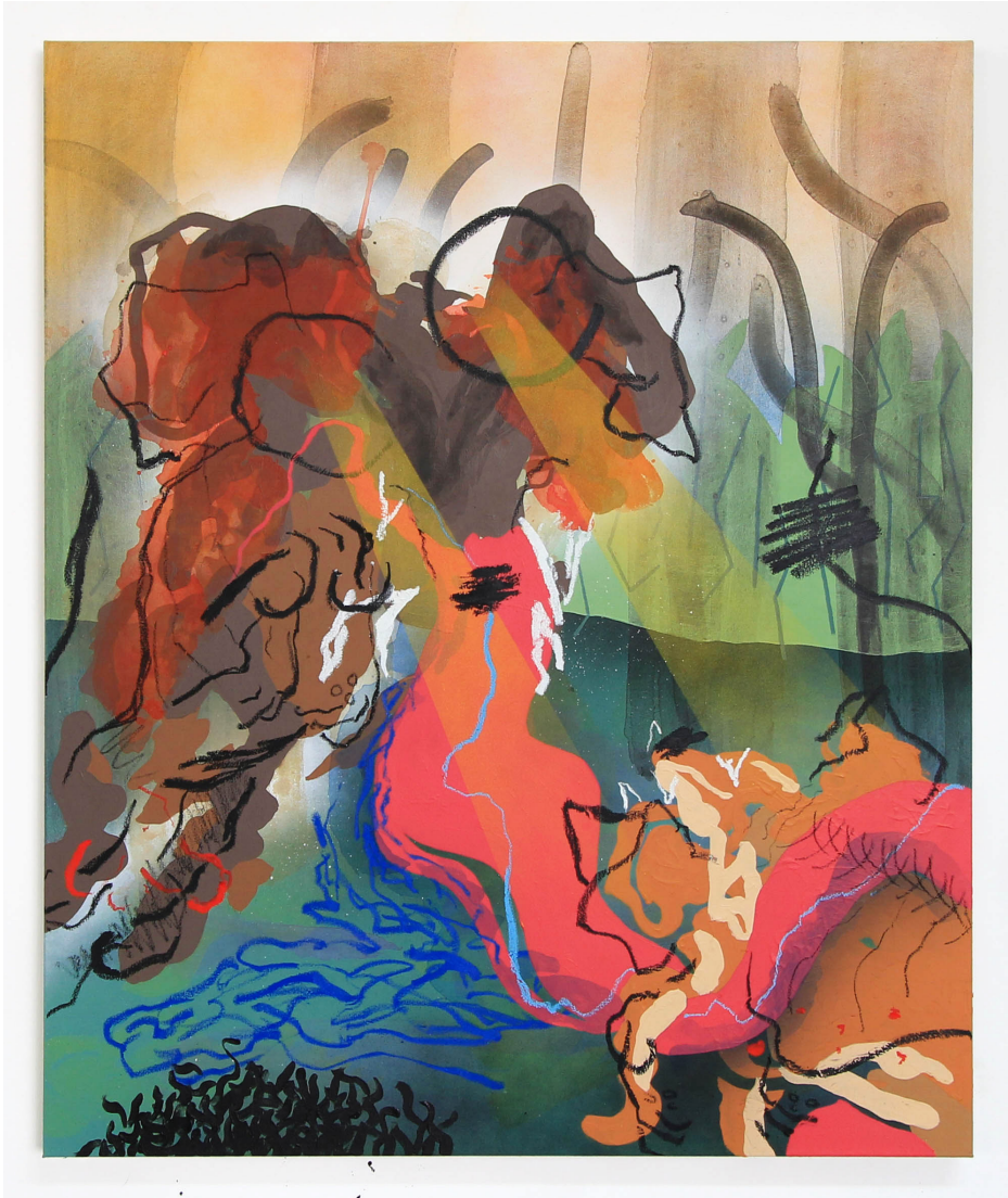
2/05/2023, 2023 Acrylique, bâton d'huile, bombe aérosol sur toile 100 x 83 cm