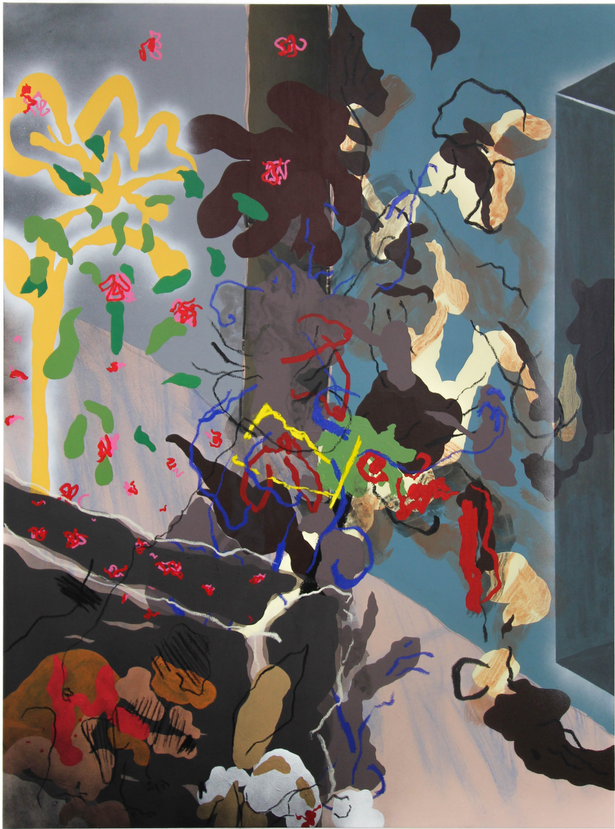
Fouille sentimentale II, 2022 Acrylique, bombe de peinture, bâton d'huile sur toile 160 x 120 cm