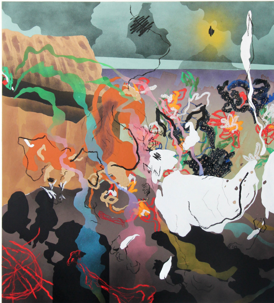
28/02/2023 , 2023 Acrylique, bâton d'huile, bombe aérosol sur toile 100 x 83 cm