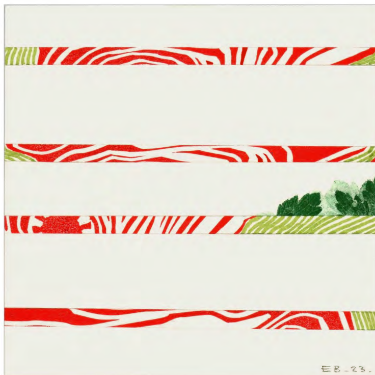
Rien ne se perd I - #7

Assemblage de chutes d'estampes et de dessins - Encre sur papier 10,5 x 10,5 cm 2023