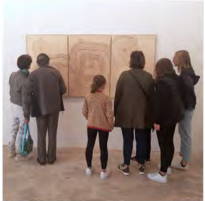
Vue de l'exposition personnelle Les herbes de la zizanie , lors des Journées Européennes du Patrimoine, Château de Courterolles, 2022