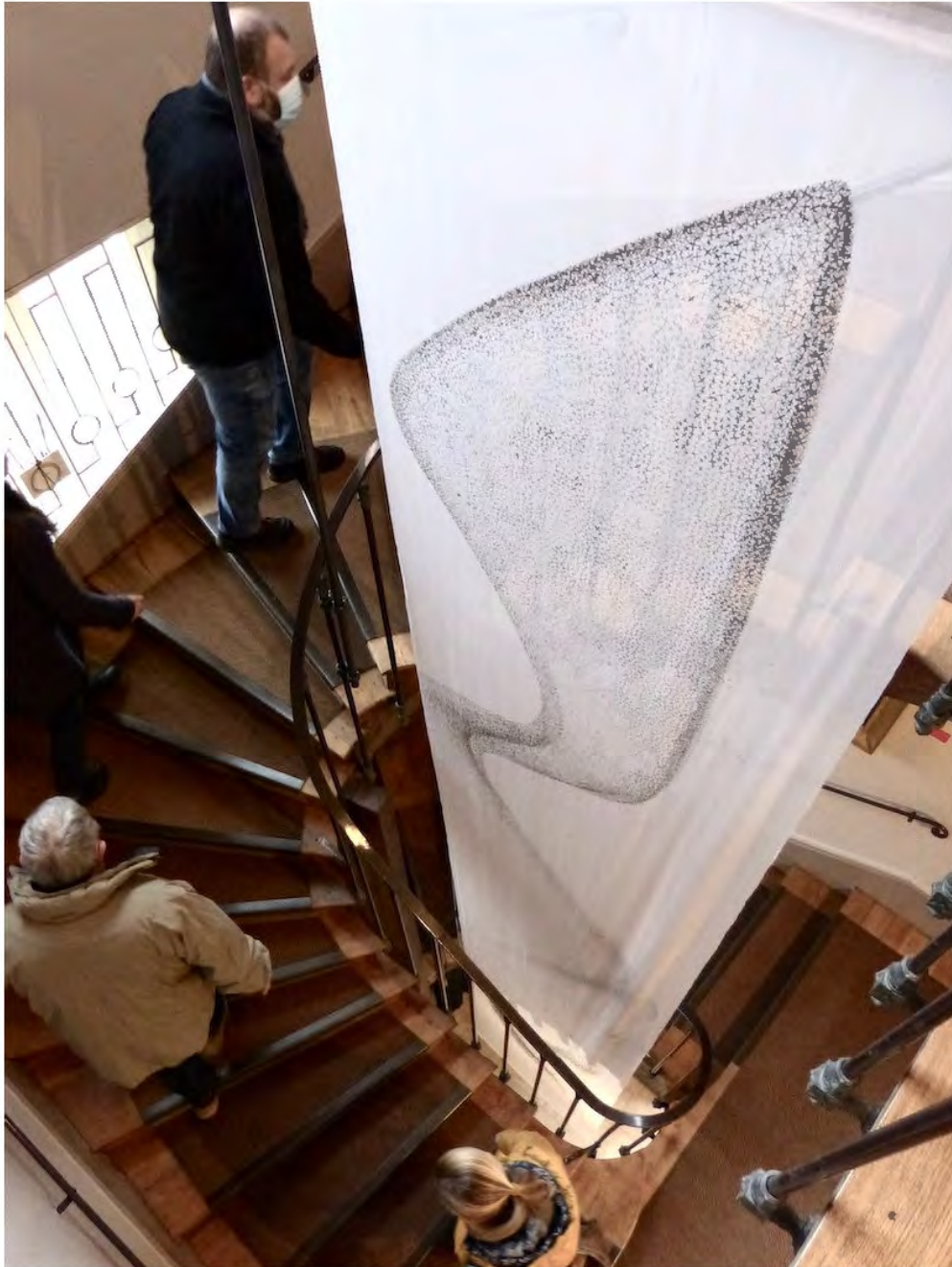
Vue de l'exposition Entre les lignes , Musée de Semur-en-Auxois, 2021

Oiseaux de passage Encre sur coton organdi 700 x 100 cm 2021