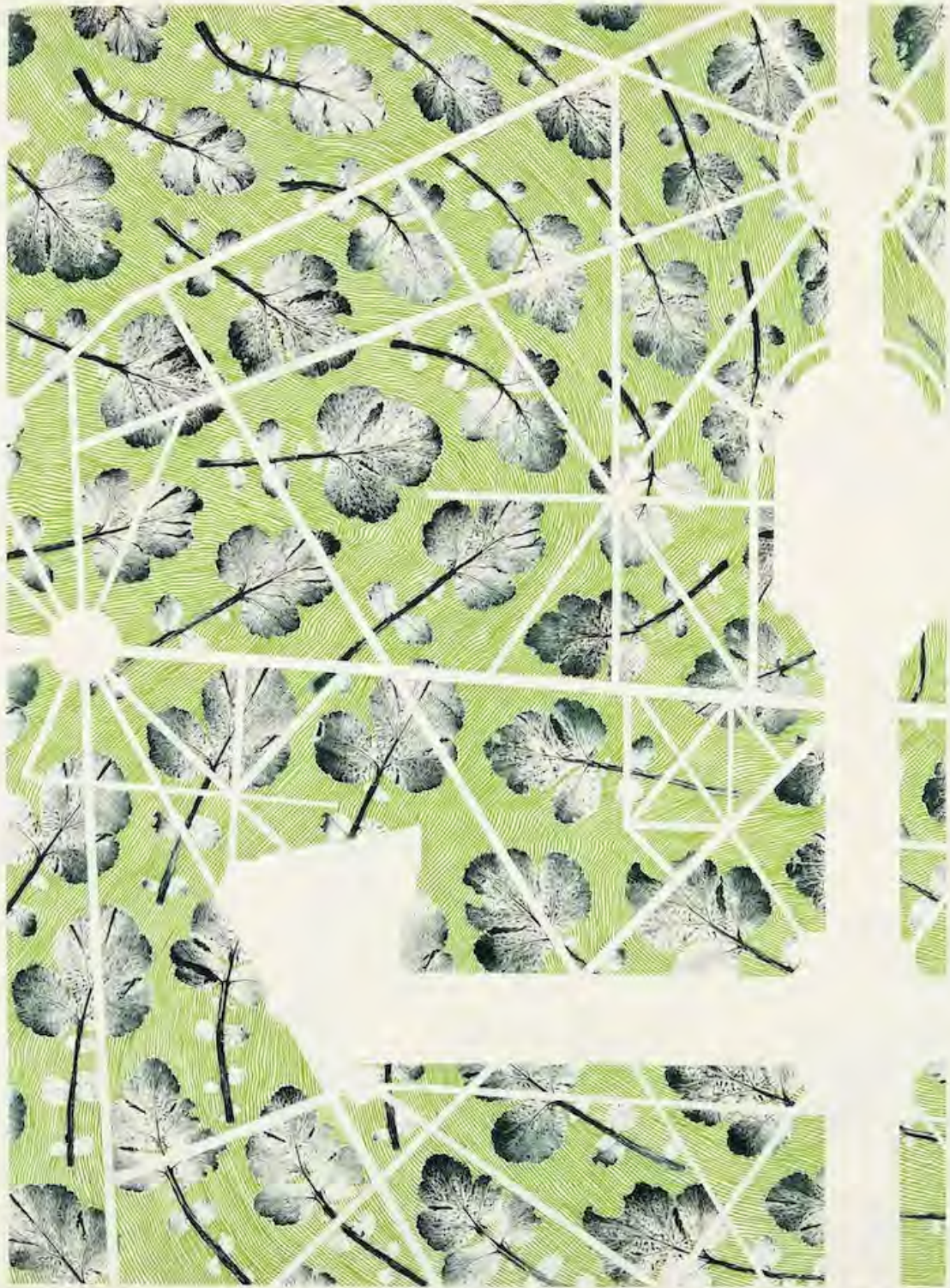
Envahir #5 Encre et feutre sur papier 75 x 57,5 cm 2023