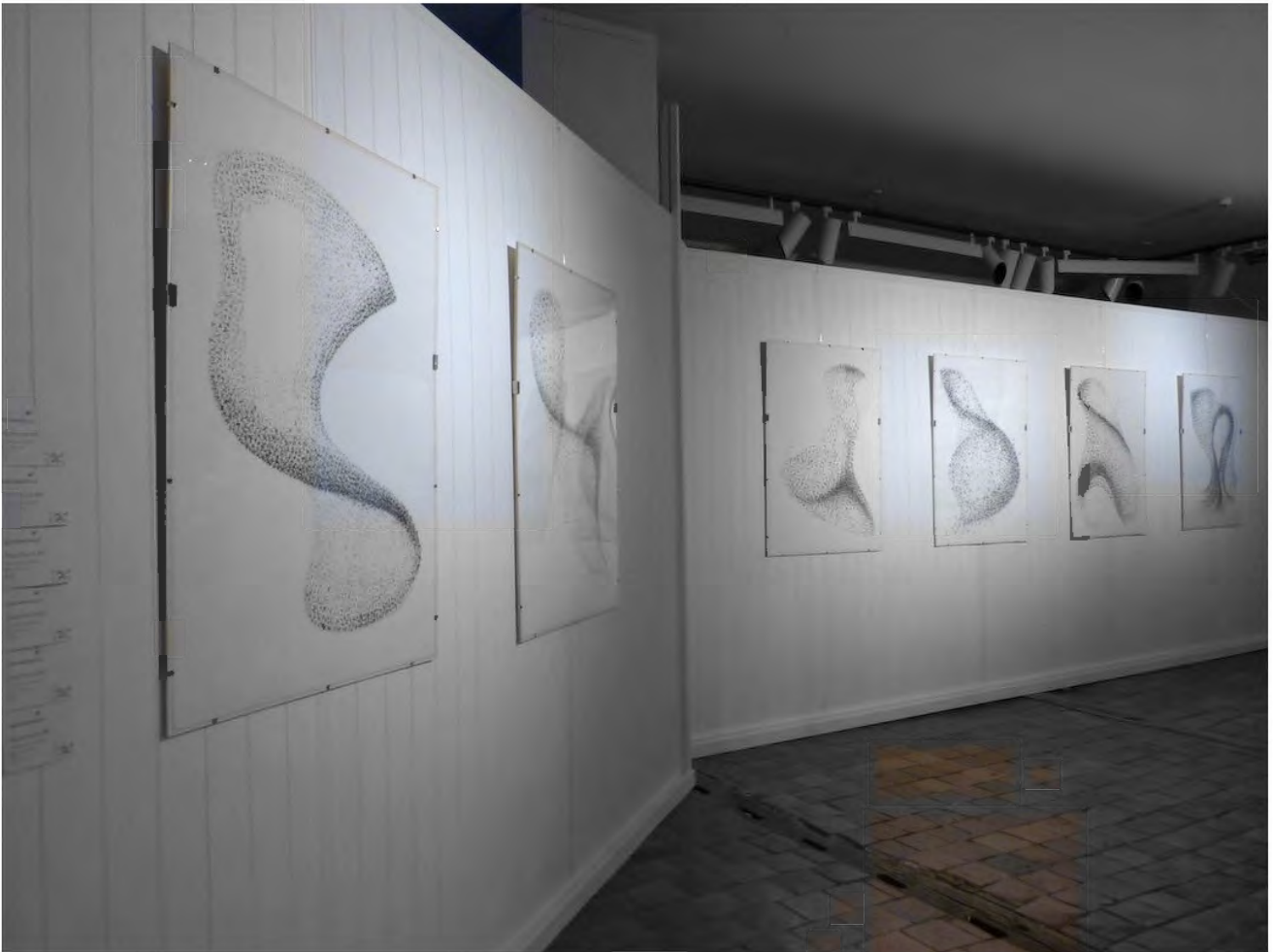
Vue de l'exposition Entre les lignes , Musée de Semur-en-Auxois, 2021

Série Murmure Estampage - encre sur papier 112 x 80 cm 2021