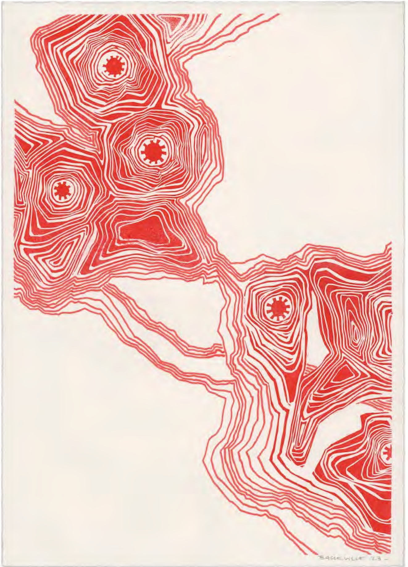
Propagation II - #1 Encre sur papier 38,7 x 27,5 cm 2023