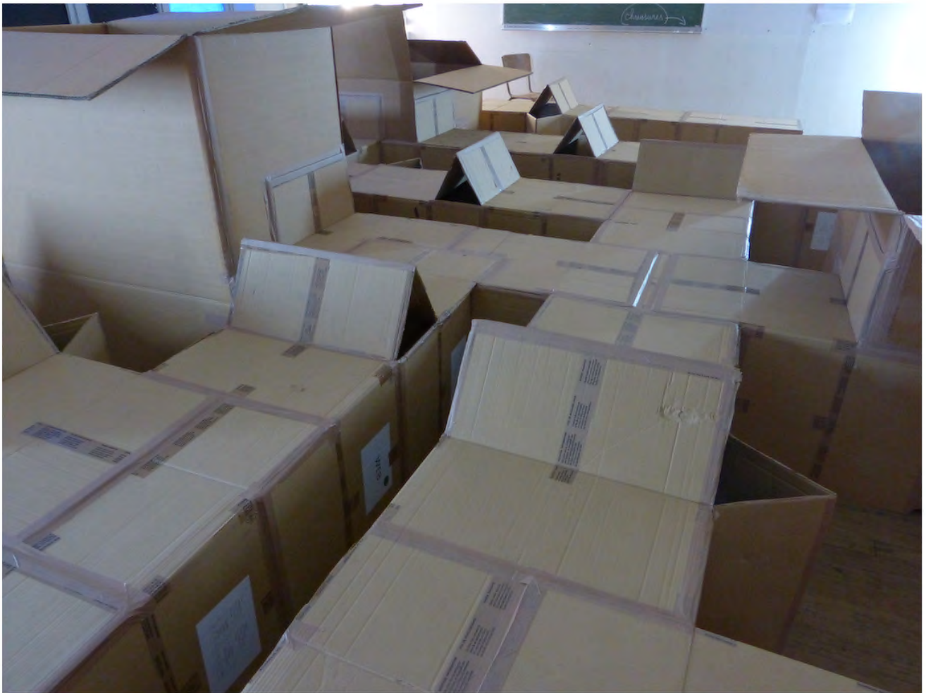
Vue du Festival d'art in situ, La grande vacance , Semur-en-Auxois, 2023 - Commissariat : Stéphanie Lemoine