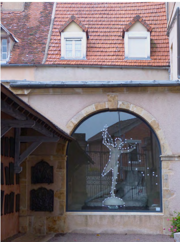
Vue de l'exposition Entre les lignes , Musée de Semur-en-Auxois, 2021