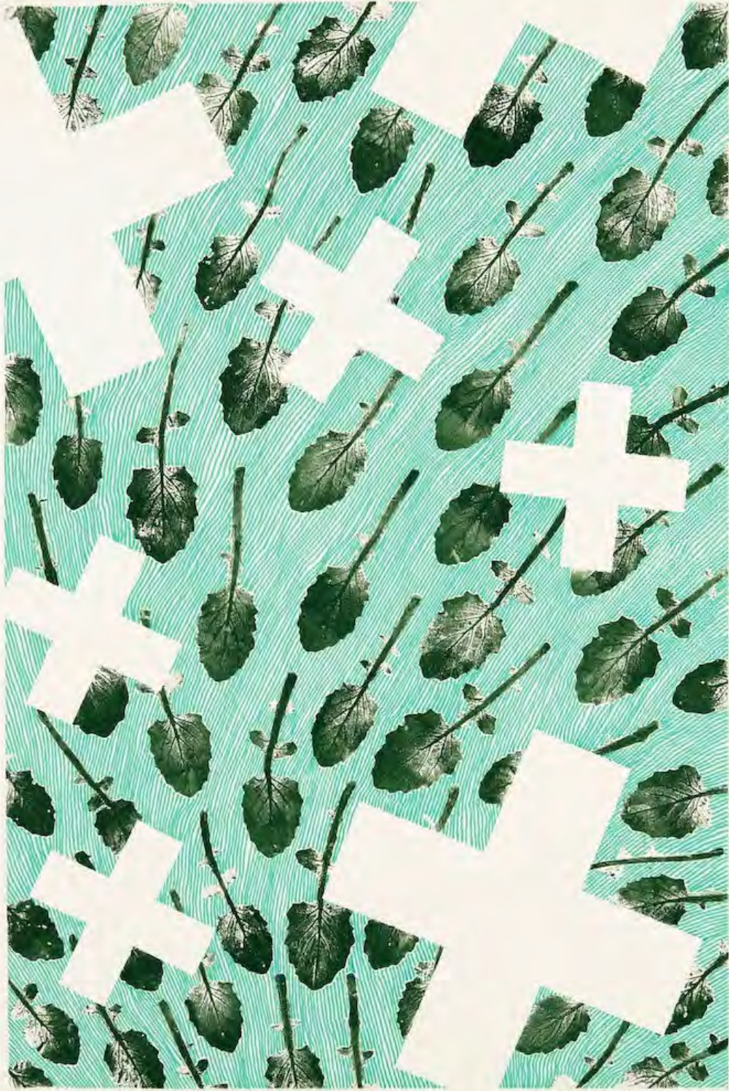
Disparaître #8 Encre et feutre sur papier 55 x 38,7 cm 2023