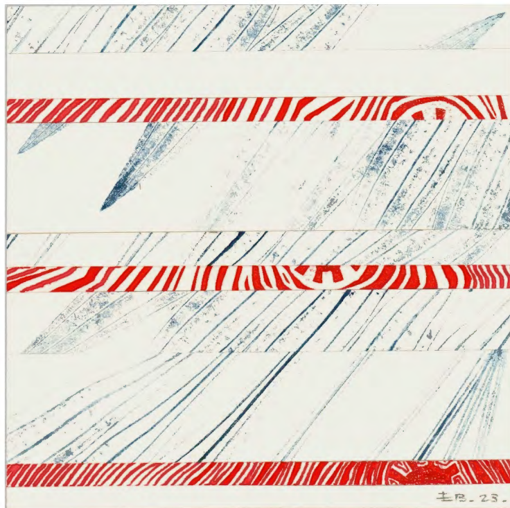
Rien ne se perd I - #13

Assemblage de chutes d'estampes et de dessins - Encre sur papier 10,5 x 10,5 cm 2023