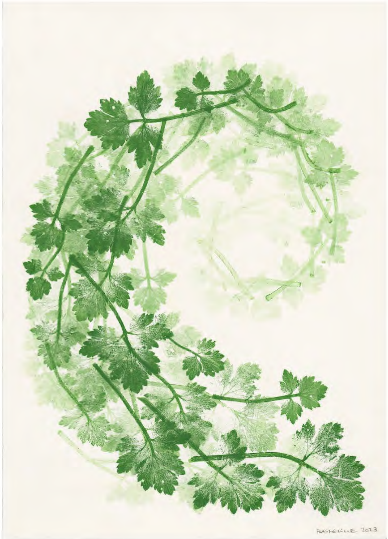
Etre vivant #6 Encre sur papier 38,7 x 27,5 cm 2023