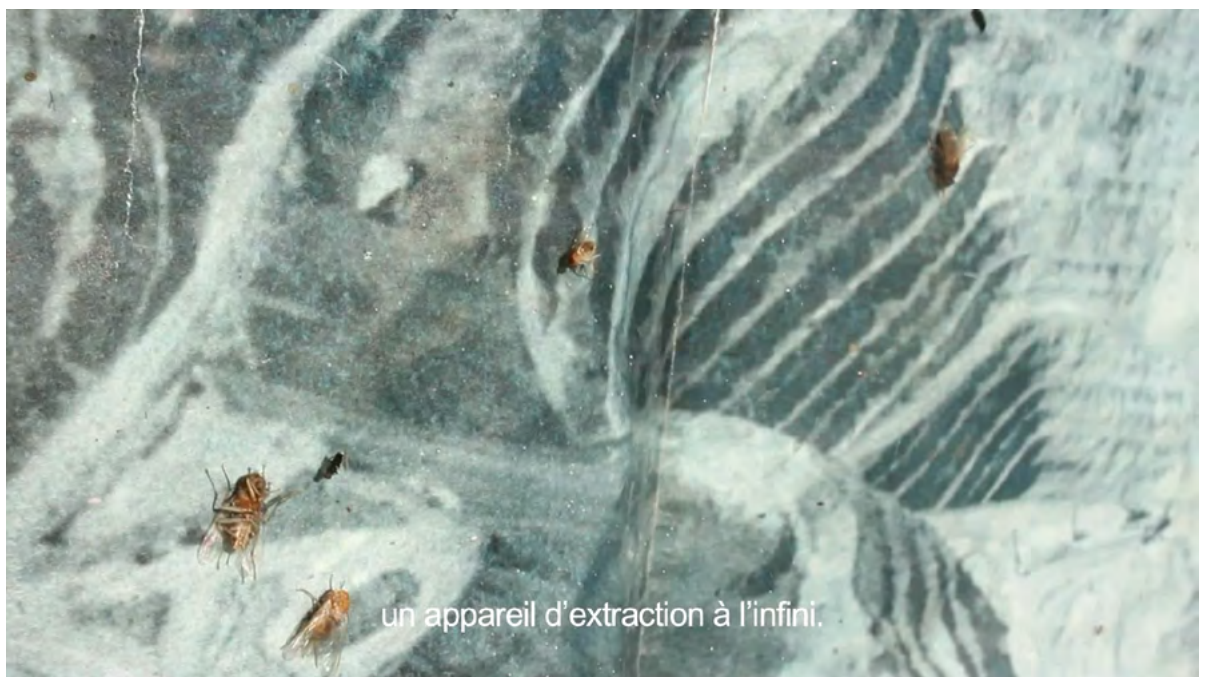
un appareil d'extraction à l'infini.