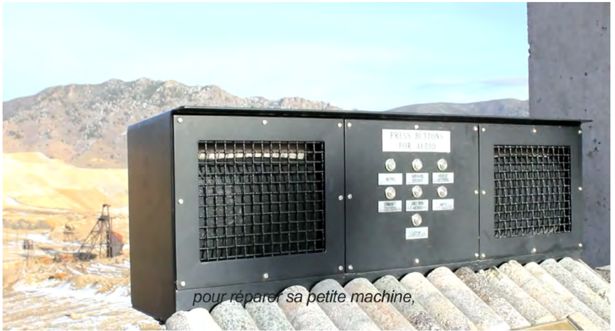
pour réparer sa petite machine,