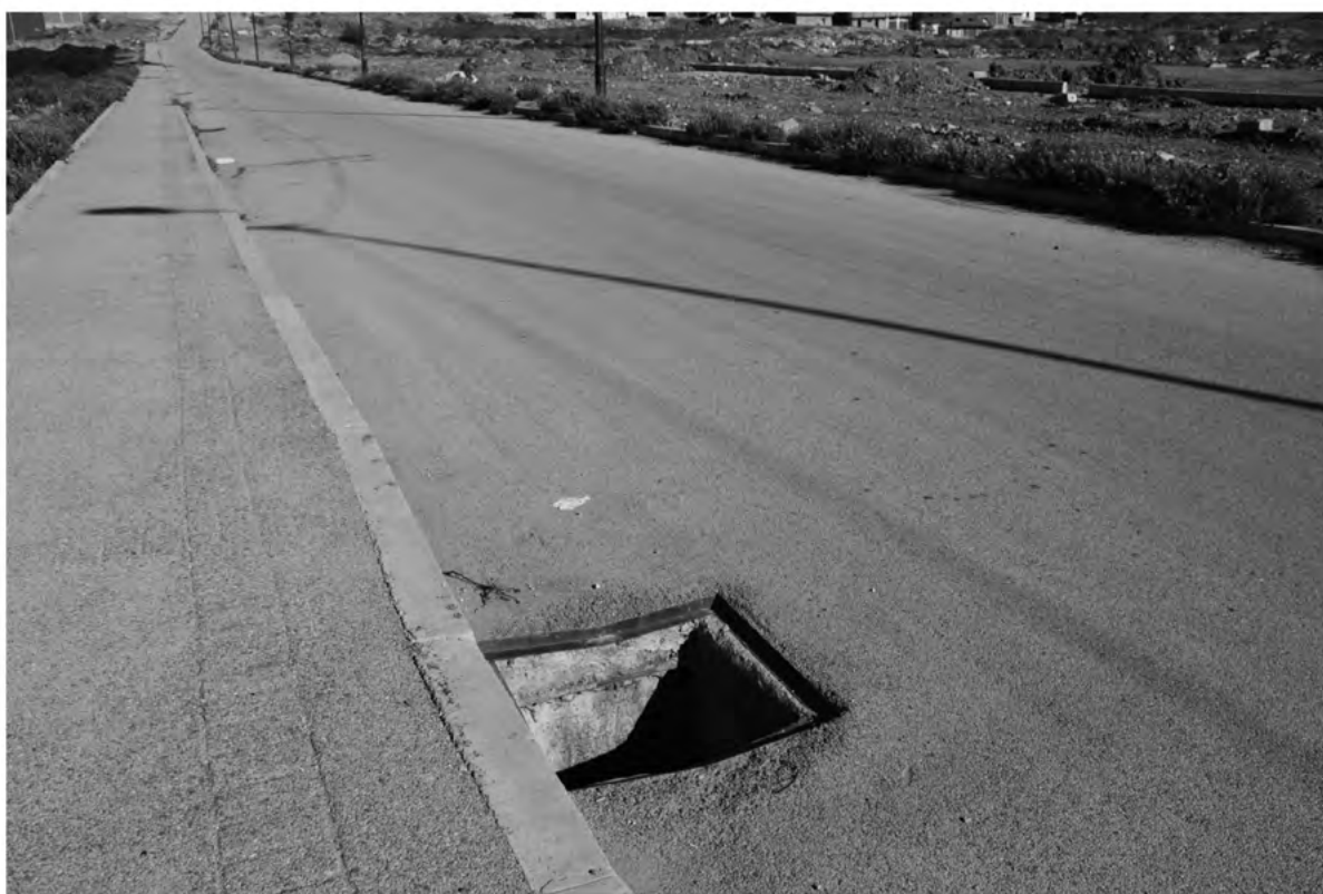
Monument au vertige (raccourci)

Édition réalisée à Tanger (Maroc) et présentée lors de l'exposition Demain les escargots , en collaboration avec la poète Sabrina Soyer. Elle eut lieu un soir sur le chariot d'un vendeur d'escargots. Tanja Balia est un nouveau quartier de Tanger, ville se transformant à grande vitesse, conséquence du projet d'urbanisme qui voudrait en faire un nouveau centre économique. Quand nous sommes venues, ce quartier se trouvait en situation d'entre-deux, dessiné pour le futur mais toujours en attente de ses habitants. J'ai réalisé une carte des monuments de Tanja Balia, dans la continuité du travail de Robert Smithson A tour of the Monument of Passaic . L'édition se désagrège avec le temps, antithèse d'un guide définitif de la ville. Certains des monuments font directement référence à la mythologie grecque présente dans l'histoire de Tanger.