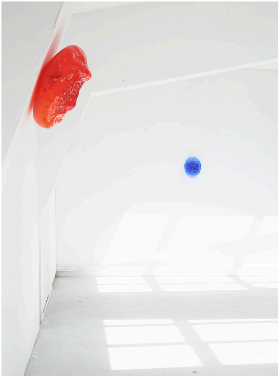
MASQUES , 2020-2021 Verres soufflés, résidus de terre de jardin, 7 éléments, Dimensions variables