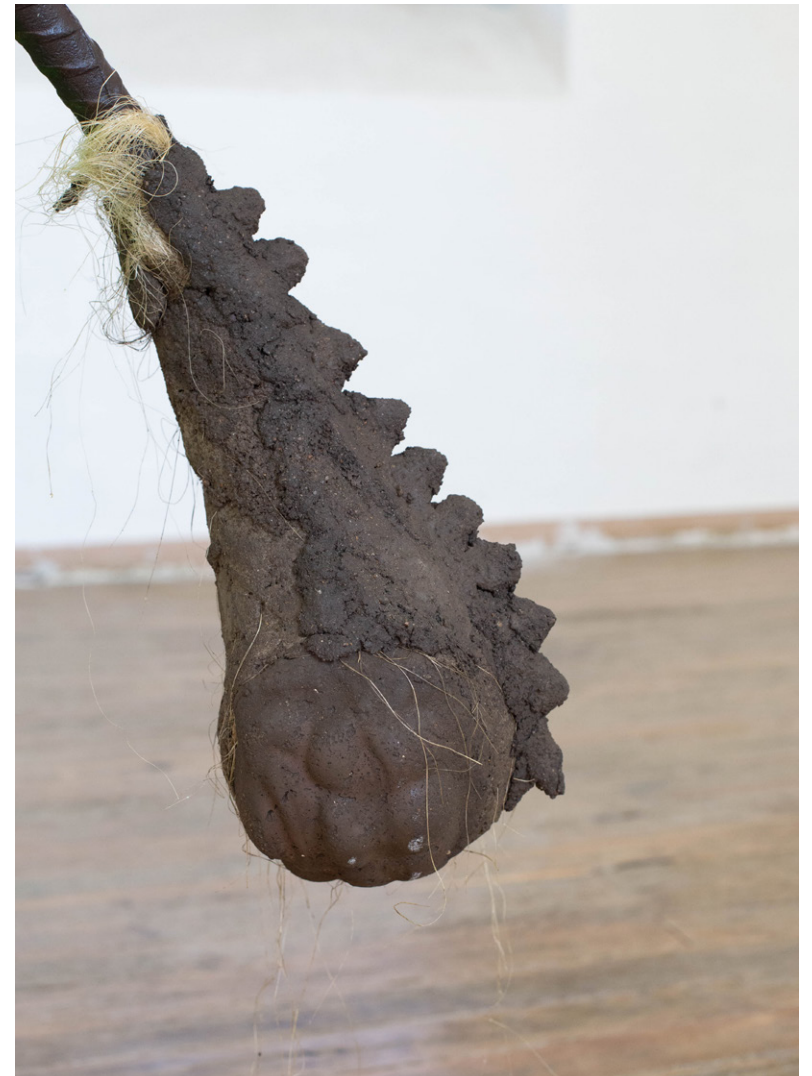
LE SERPENT , 2023 Masque et modelage en ciment fondu, fer à béton cintré, chaise d'école peinte Exposition Après-midi de chien , 2023, Chagny