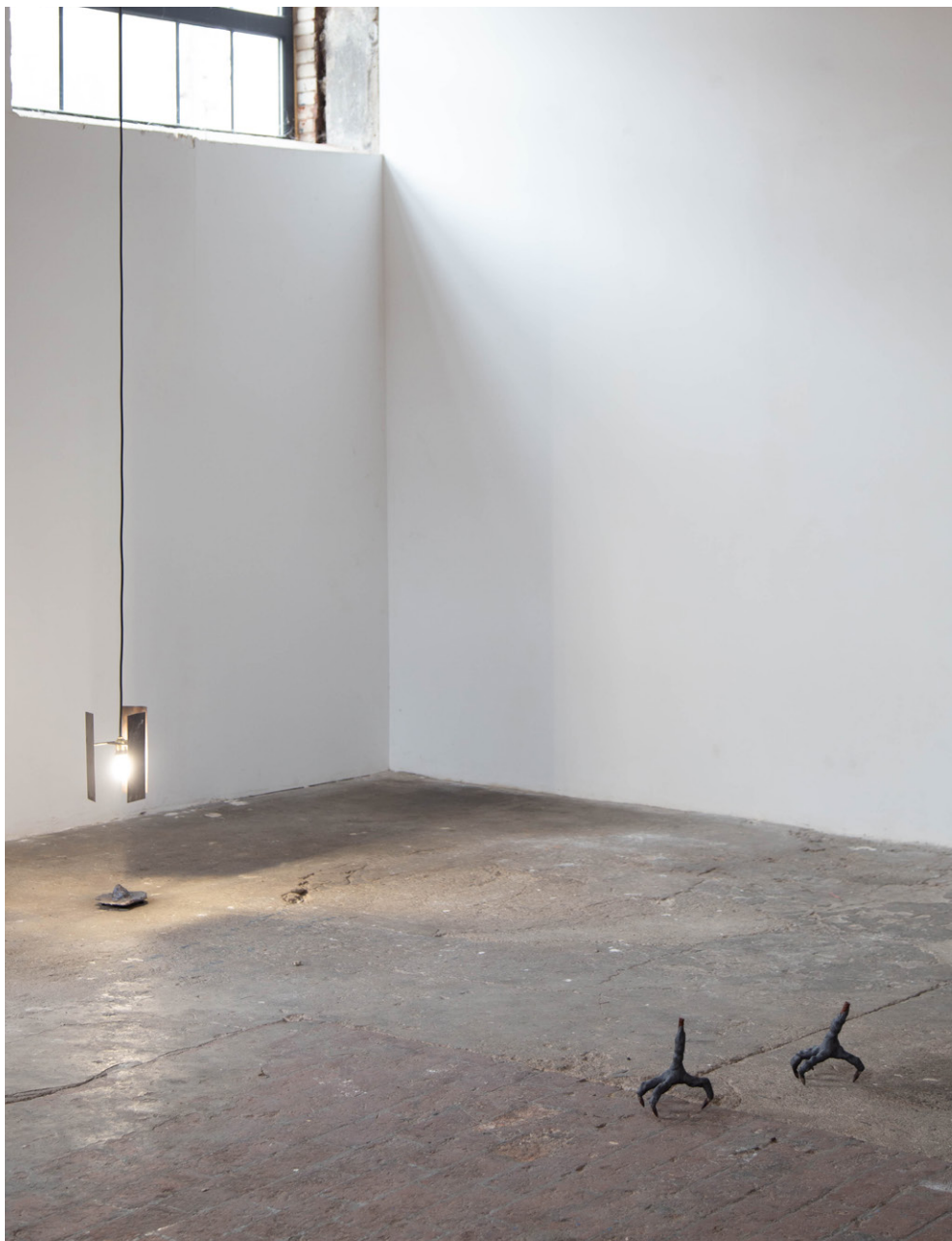
SABBATH BLOODY SABBATH PART 2 , 2023 Fers à béton, plastiline Exposition Columba Livia , 2023, Atelier White-cubi, Dijon