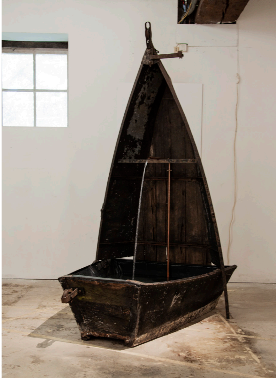
LE PASSEUR , 2019 Barque sciée, Pompe, Tube d'acier, Eau, 200 x 100 x 250cm Exposition PAS BESOIN DE CONSTAT , Chagny