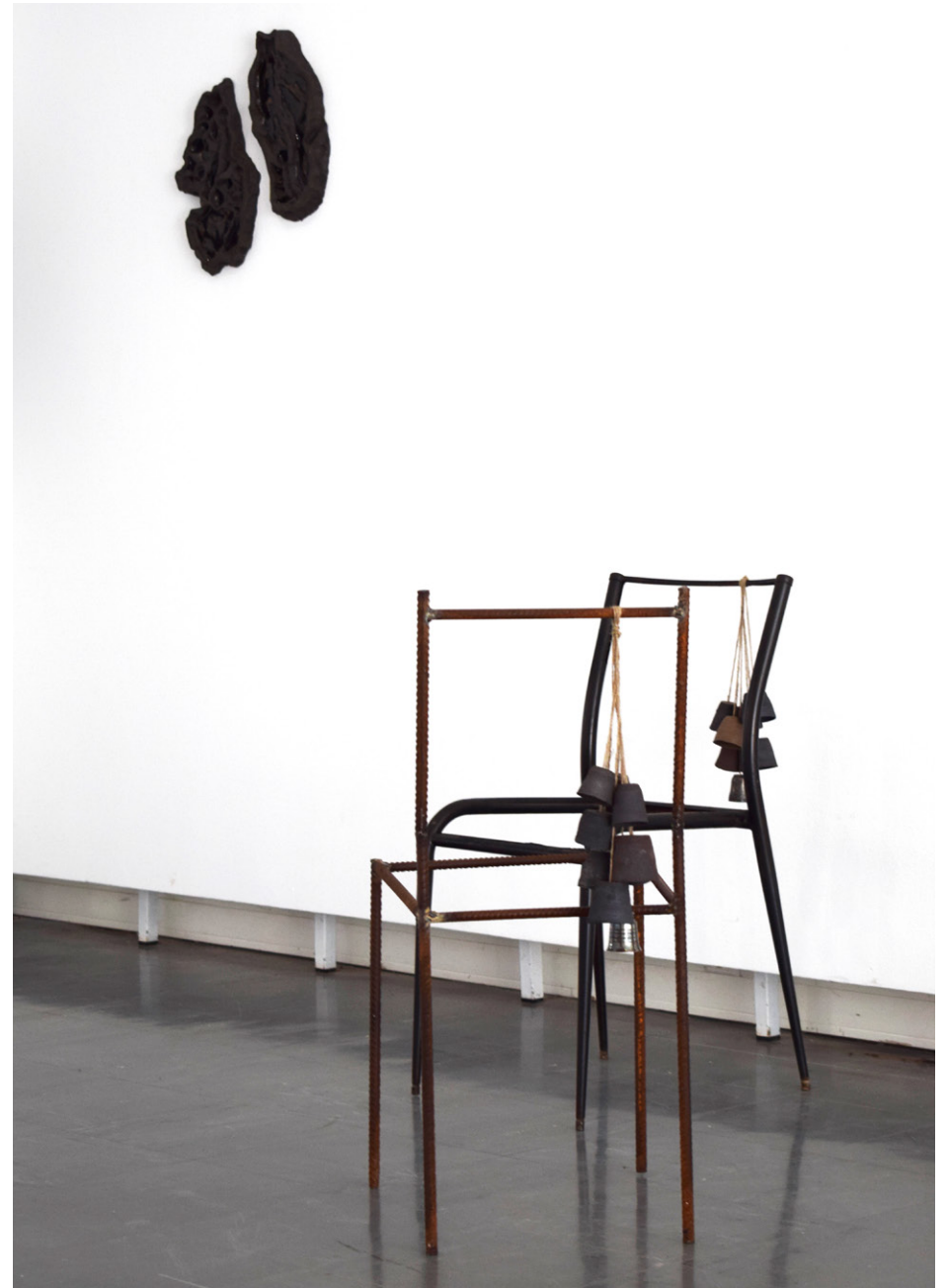
Exposition Des Origines , 2023, La cantine d'art contemporain, Belfort