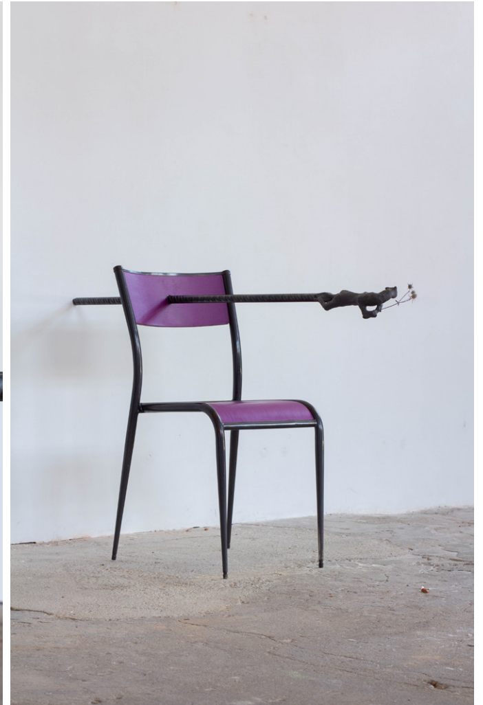
SANS TITRE À LA FLEUR n°2 , 2023 modelage en plastiline, fleur séchée, fer à béton, chaise d'école peinte Exposition Sur un coin de table , 2023, Besançon