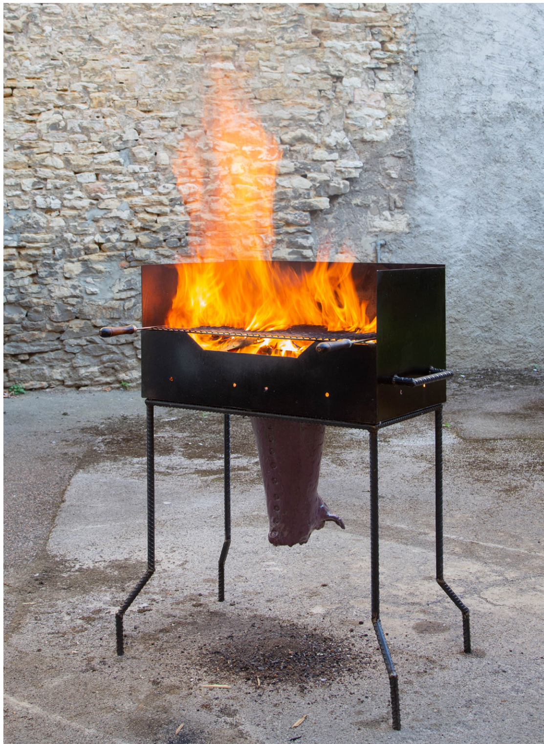
CALCIFER , 2023 Barbecue en acier, gargouille en grès émaillé, grille de cuisson Exposition Après-midi de chien , 2023, Chagny