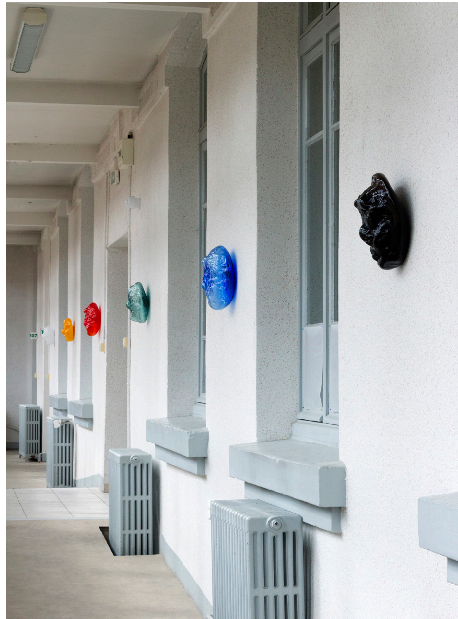
Exposition DES TROUS DANS LES MURS , 2021, Chagny