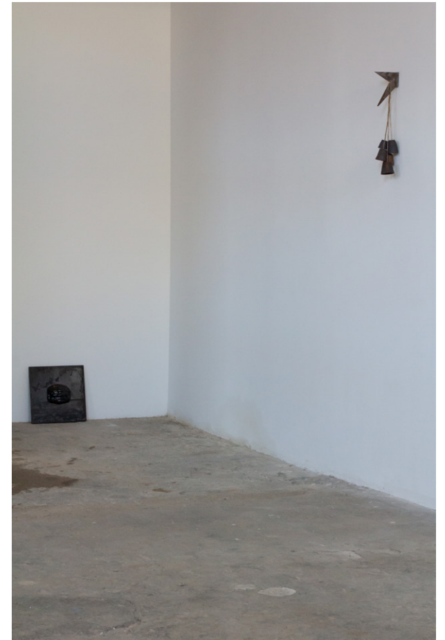
Exposition L'HABIT NE FAIT PAS LE RAMONEUR , 2023 Atelier White-Cubi, Dijon