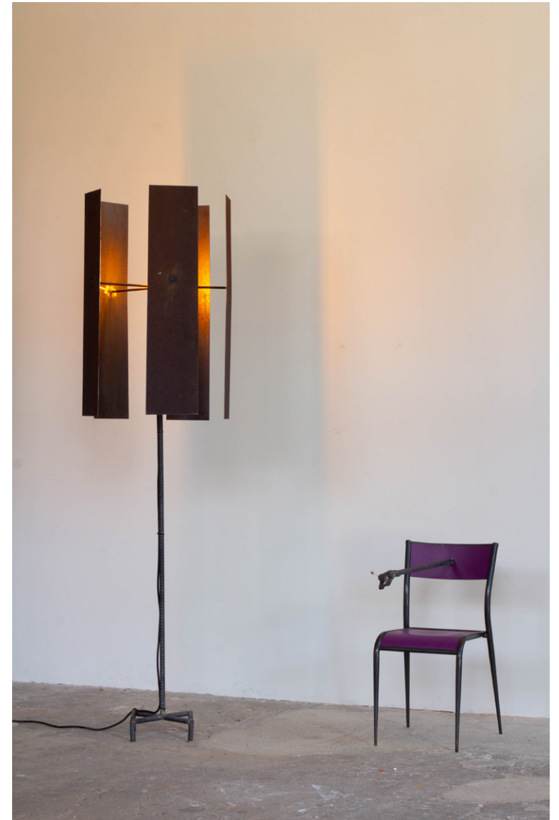
GRANDE LAMPE , 2023 plaques d'acier, fer à béton, câble électrique et ampoule Exposition Sur un coin de table , 2023, Besançon