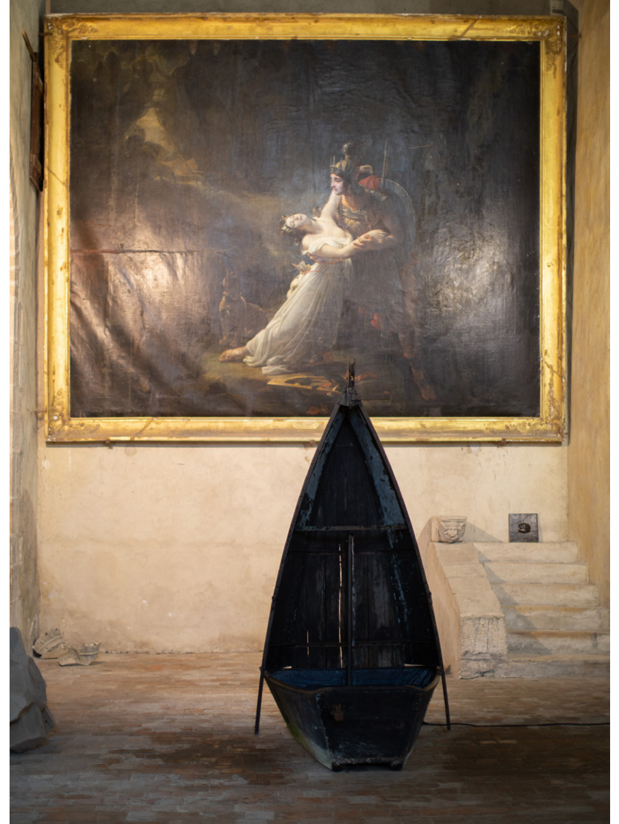
Exposition Trois petits tours et puis s'en vont , 2023, église-musée St Nazaire, Bourbon-Lancy