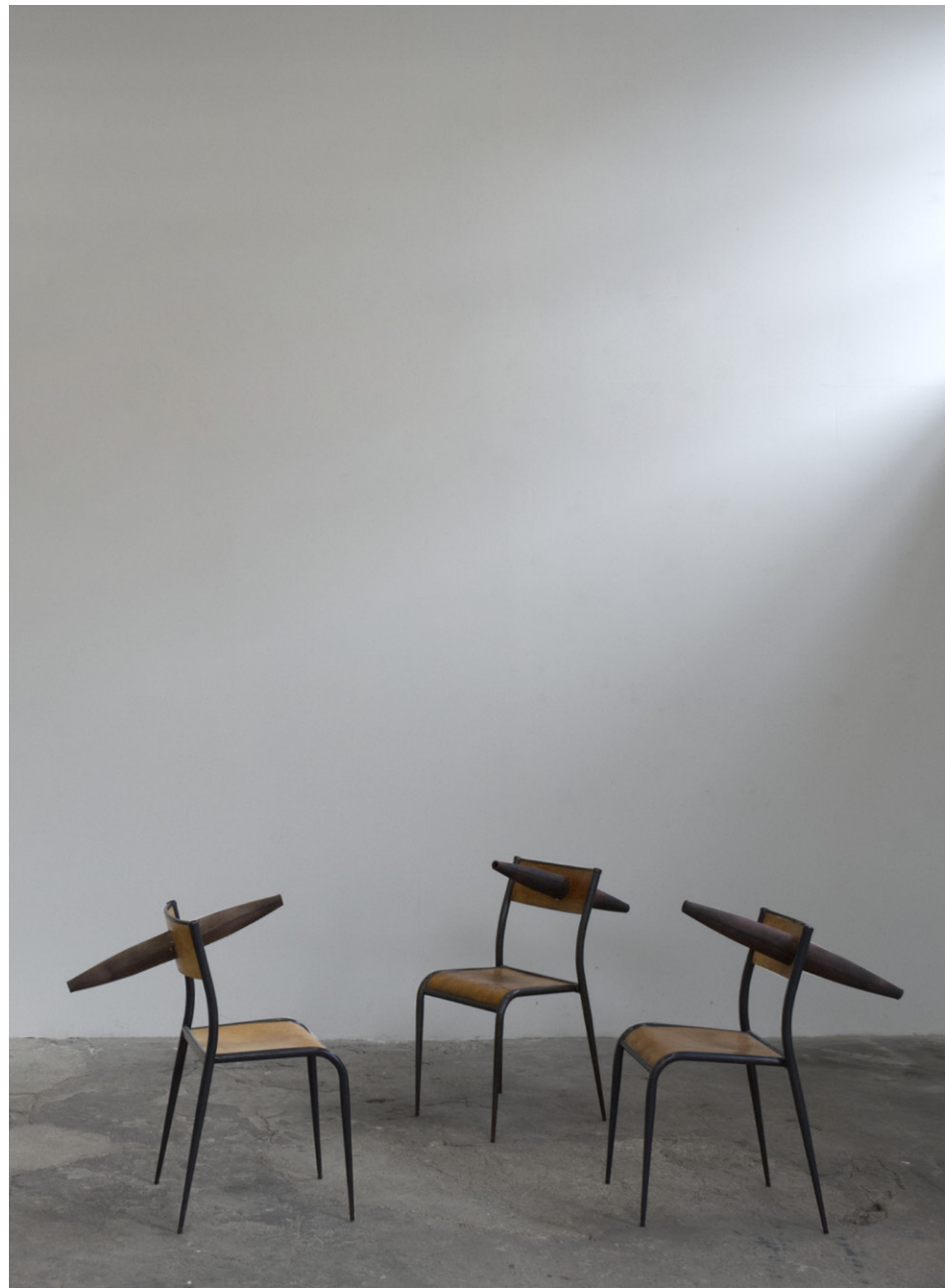
LA CONVERSATION , 2022 Chaises d'école, Terre cuite, 3 à 5 éléments, Installation - dimensions variables