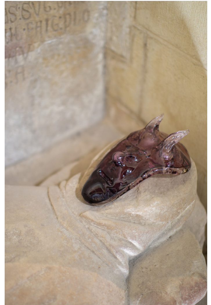
MASQUE CORNU , 2023 Masque en verre soufflée greffé sur un tombeau de l'église St Nazaire Exposition Trois petits tours et puis s'en vont , 2023, église-musée St Nazaire, Bourbon-Lancy