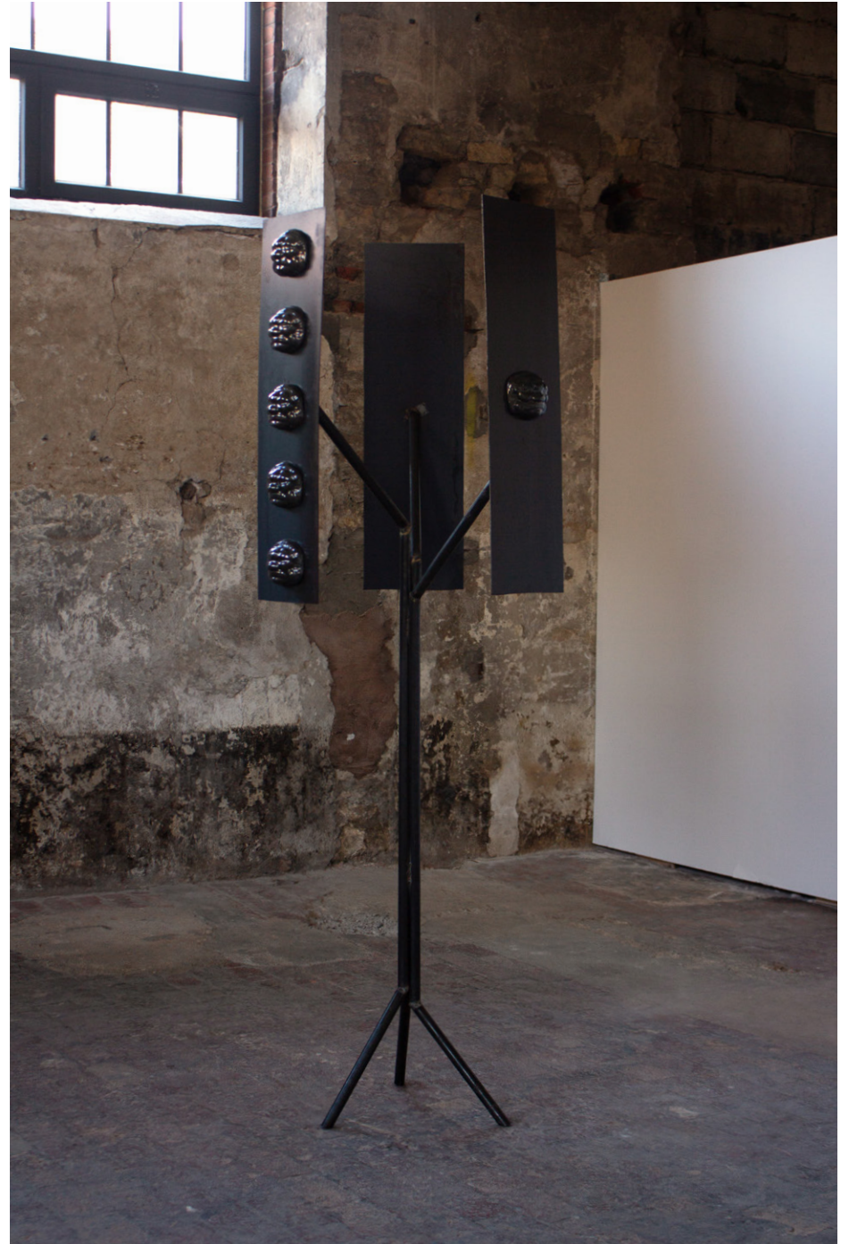
PERROQUET , 2023 Acier, Masques en céramique (9 éléments) ,75x 75x 215cm