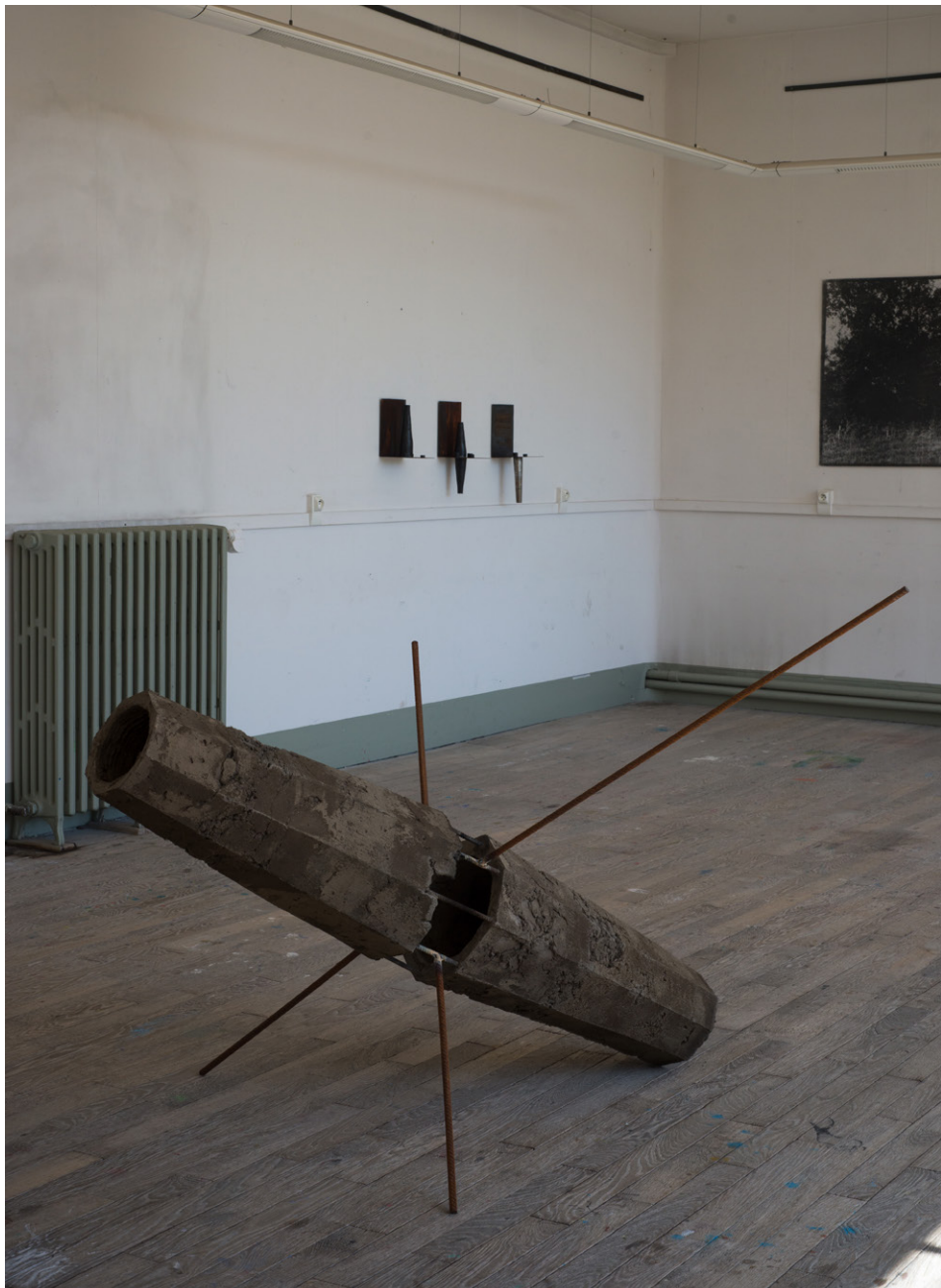
SATELITE , 2022 Ciment fondu, Trace de corde, Fer à béton, 180cm x 200cm, exposition Y'a de l'orage , 2022, Chagny