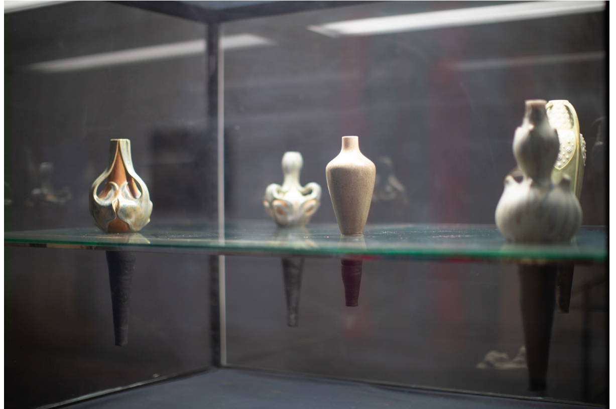
RENVERSEMENT , 2023 5 vases en céramique soudés en miroir de 5 vases de la collection du musée. Exposition Trois petits tours et puis s'en vont , 2023, église-musée St Nazaire, Bourbon-Lancy