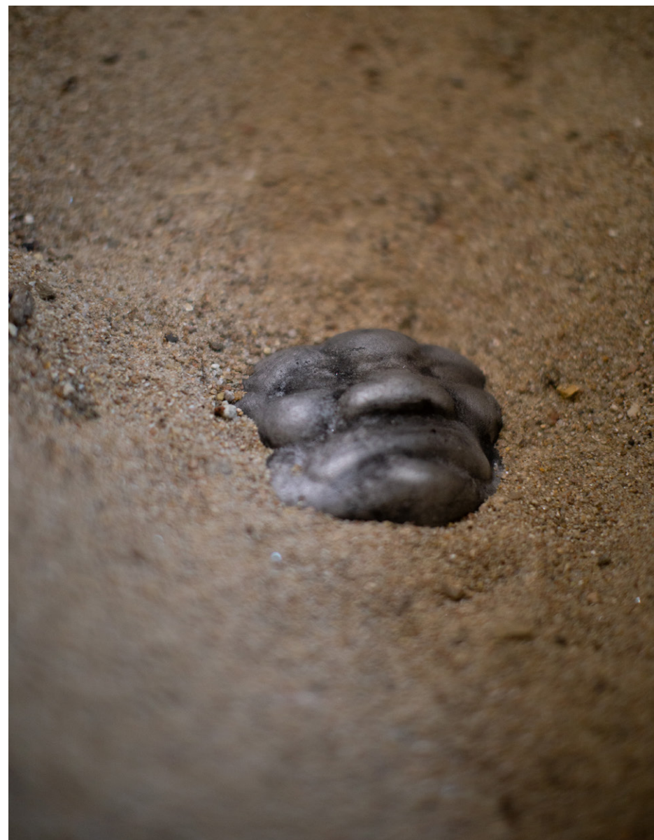
CRASH-TEST , 2023 Masque en aluminium recyclé déposé dans un sarcophage mérovingien Exposition Trois petits tours et puis s'en vont , 2023, église-musée St Nazaire, Bourbon-Lancy