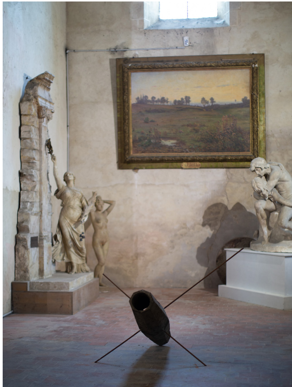
Exposition Trois petits tours et puis s'en vont , 2023, église-musée St Nazaire, Bourbon-Lancy