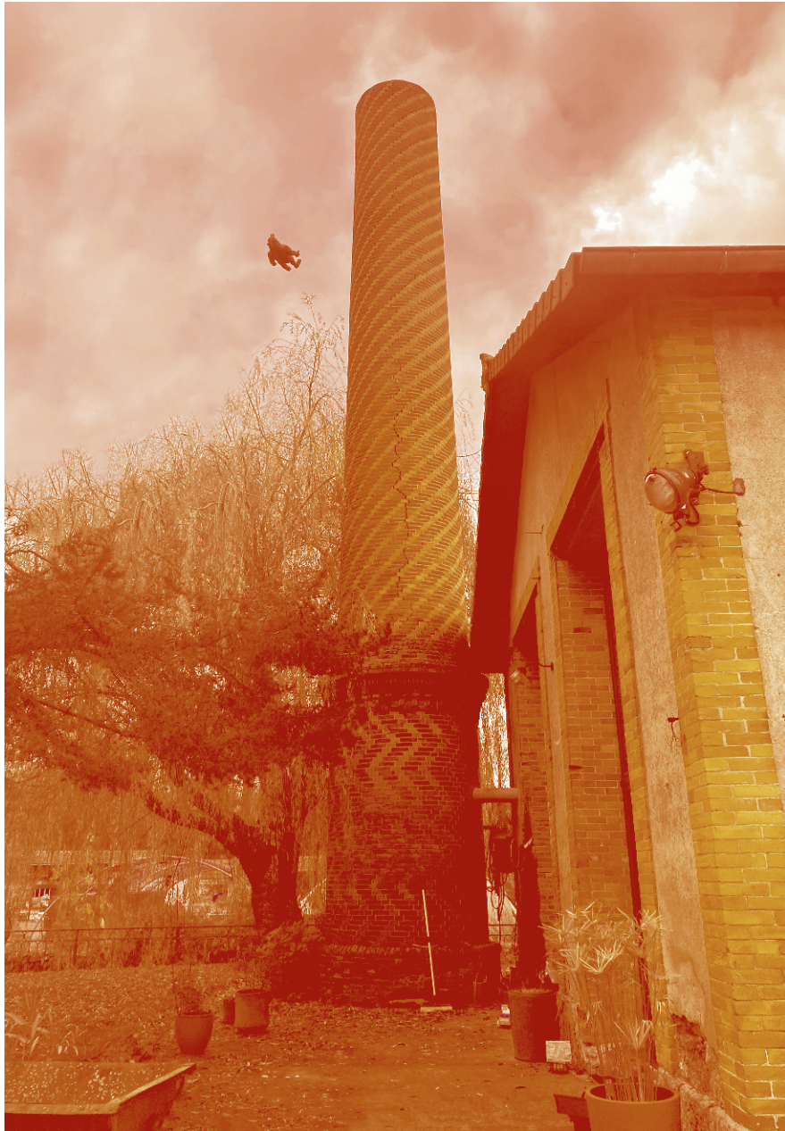
L'HABIT NE FAIT PAS LE RAMONEUR , 2023 Photo risographie, 29,7 x 42 cm