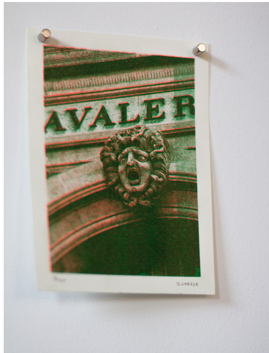
AVALER , 2023 Photo risographie, 14,8 x 10,5 cm