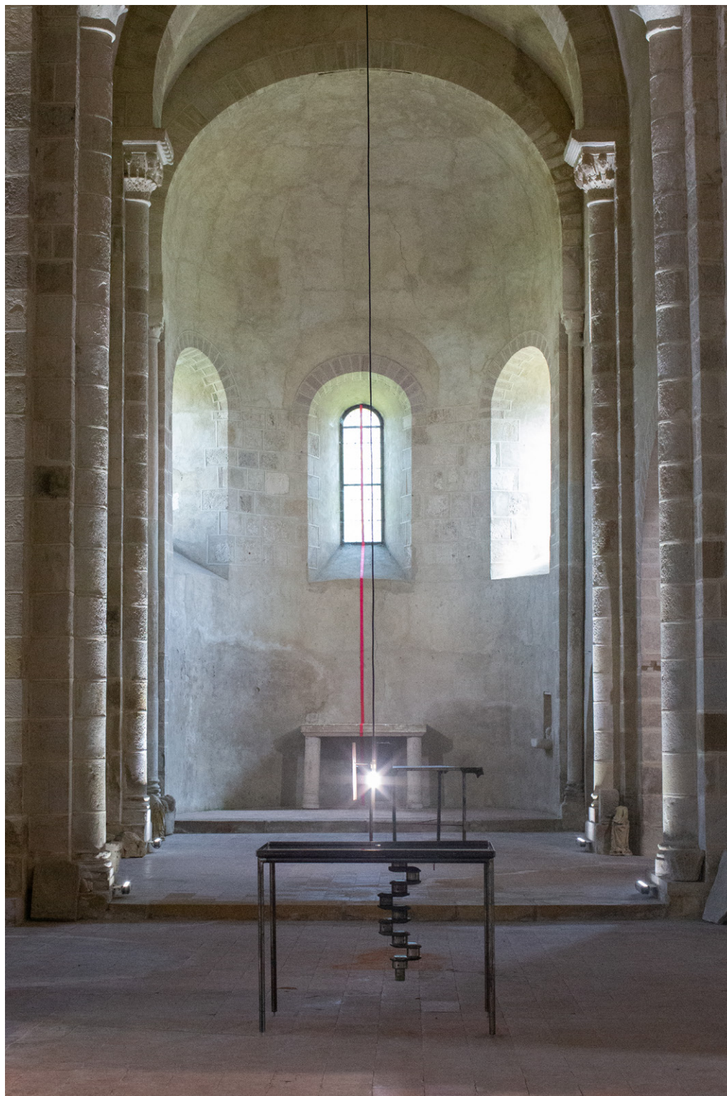
Exposition Trois petits tours et puis s'en vont , 2023 Eglise-musée St Nazaire, Bourbon-Lancy