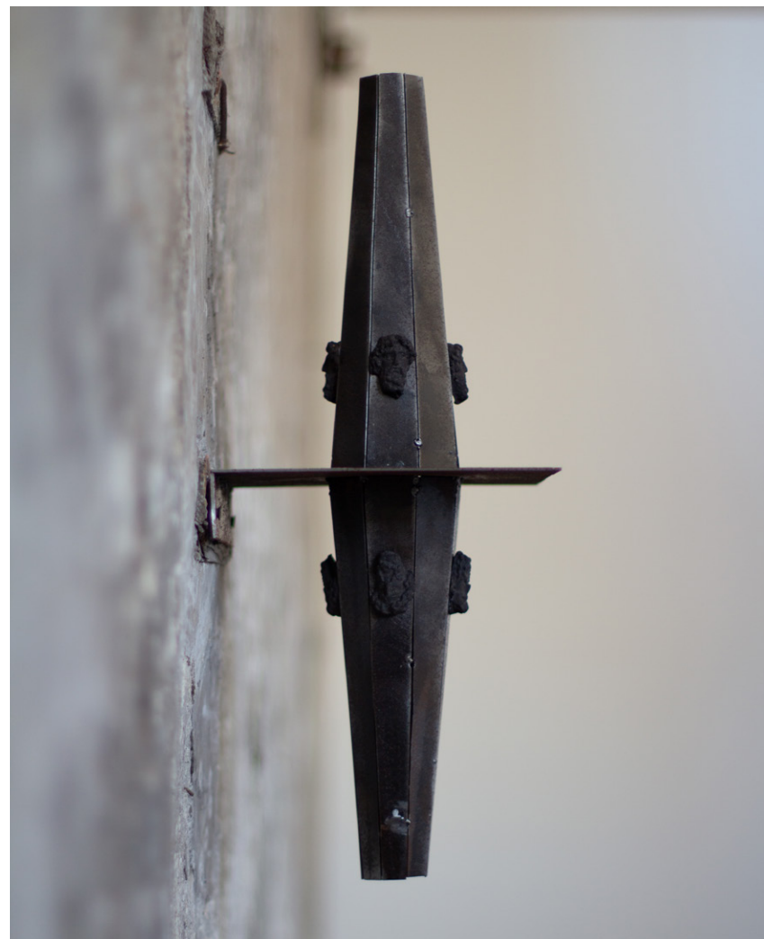
MAQUETTE n°4 , 2023 Acier, Masques en céramique (8 éléments), 60x 15 x 15cm