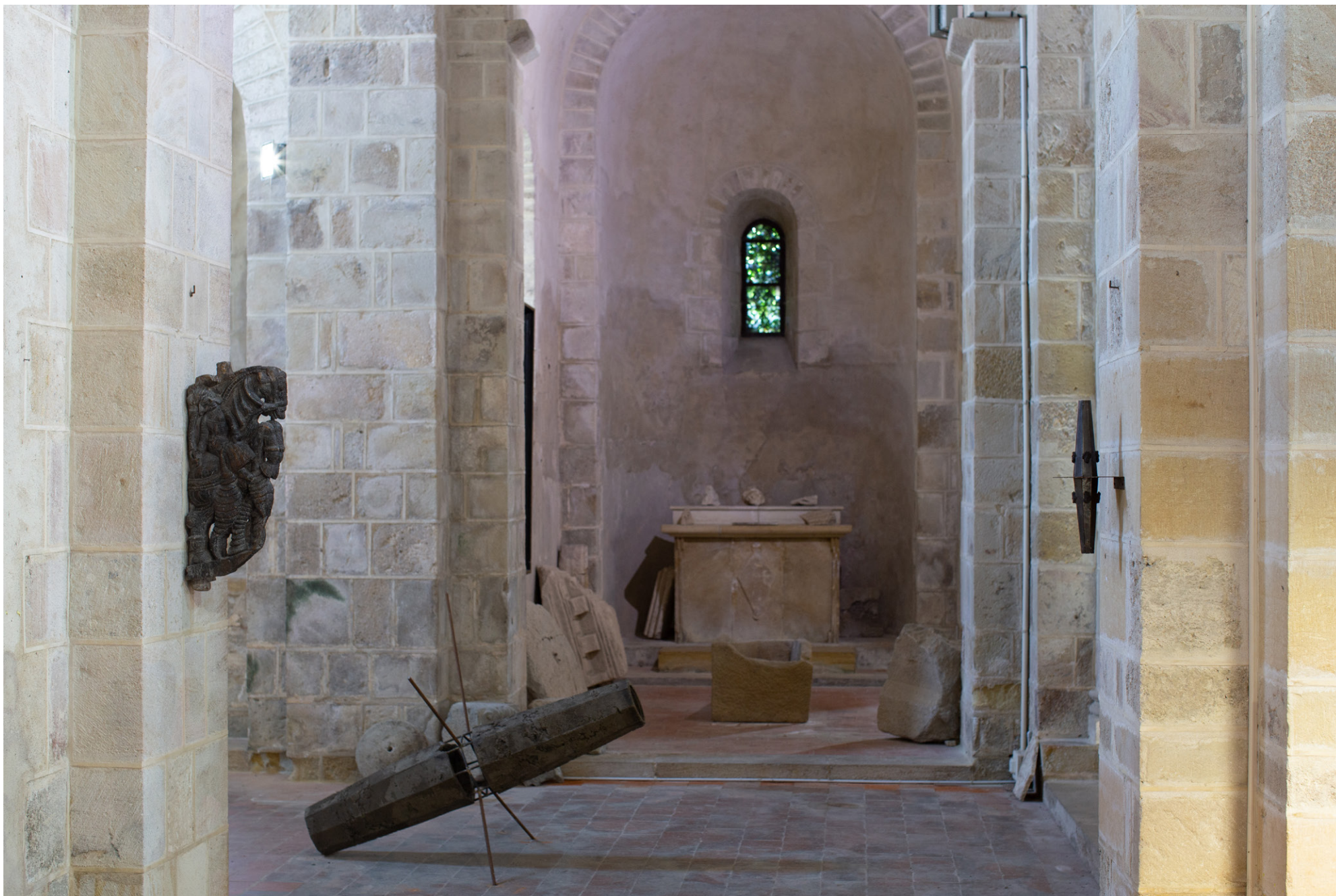
Exposition Trois petits tours et puis s'en vont , 2023, église-musée St Nazaire, Bourbon-Lancy