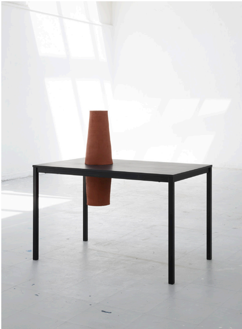
LA CHEMINEE C'EST LE PUITS , 2021 Terre cuite, Trace de corde, Table, 110 x 67 x 124cm