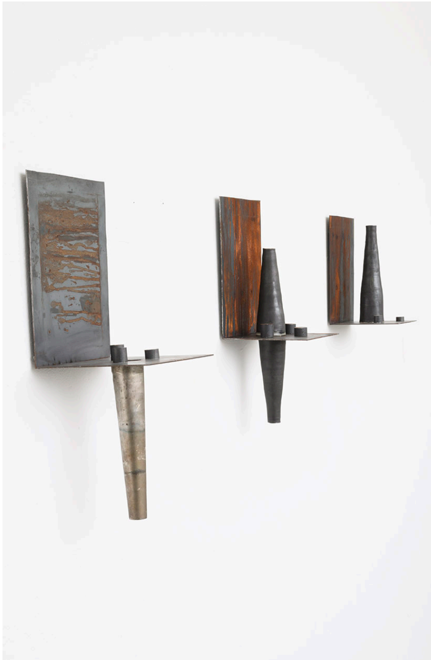
MAQUETTES n°1, n°2, n°3, 2022 Céramiques, Acier, 50x 15 x 15cm, 3 éléments