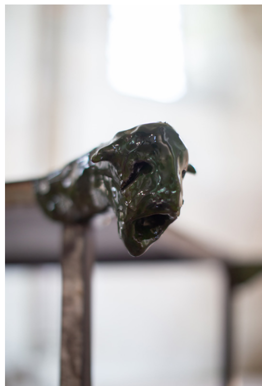
LES GARGOUILLES , 2023 Acier, Céramiques