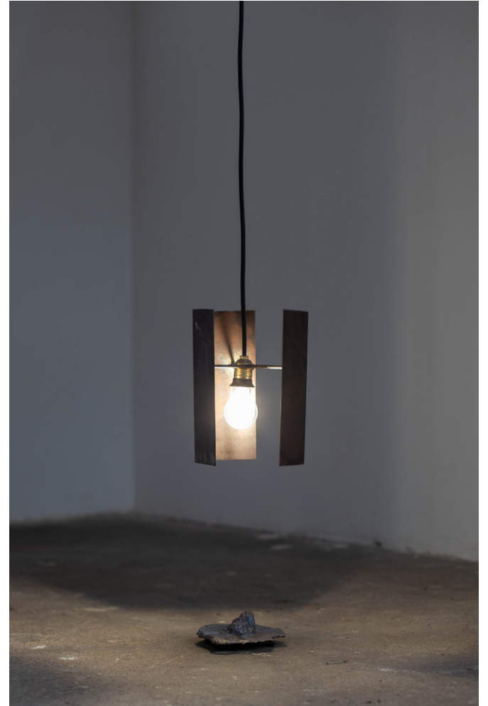
SABBATH BLOODY SABBATH PART 1 , 2023 Photogramétrie d'une tête de pigeon, impression 3D, tirage en plomb, acier, câble électrique, ampoule Exposition Columba Livia , 2023, Atelier White-cubi, Dijon