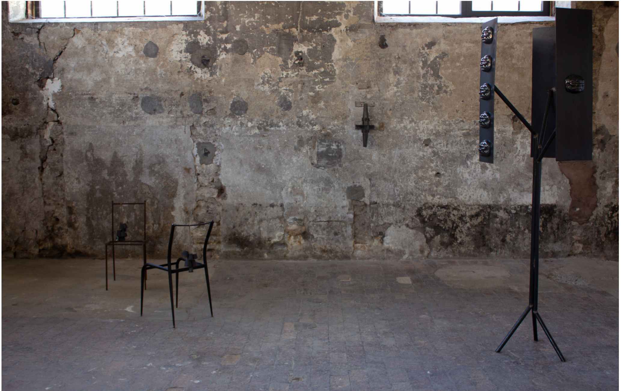
Exposition L'HABIT NE FAIT PAS LE RAMONEUR , 2023 Atelier White-Cubi, Dijon