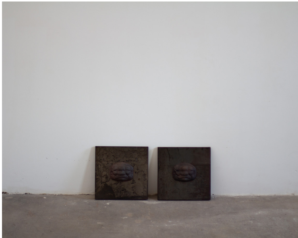
SANS TITRE , 2023 Acier, Masques en céramique, 30 x 30 x 10 cm, trois éléments