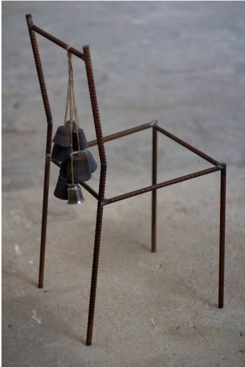
BOUQUETS , 2022 Chaise d'école brûlée, Fer à béton, Corde, Terre Cuite, dimensions variables