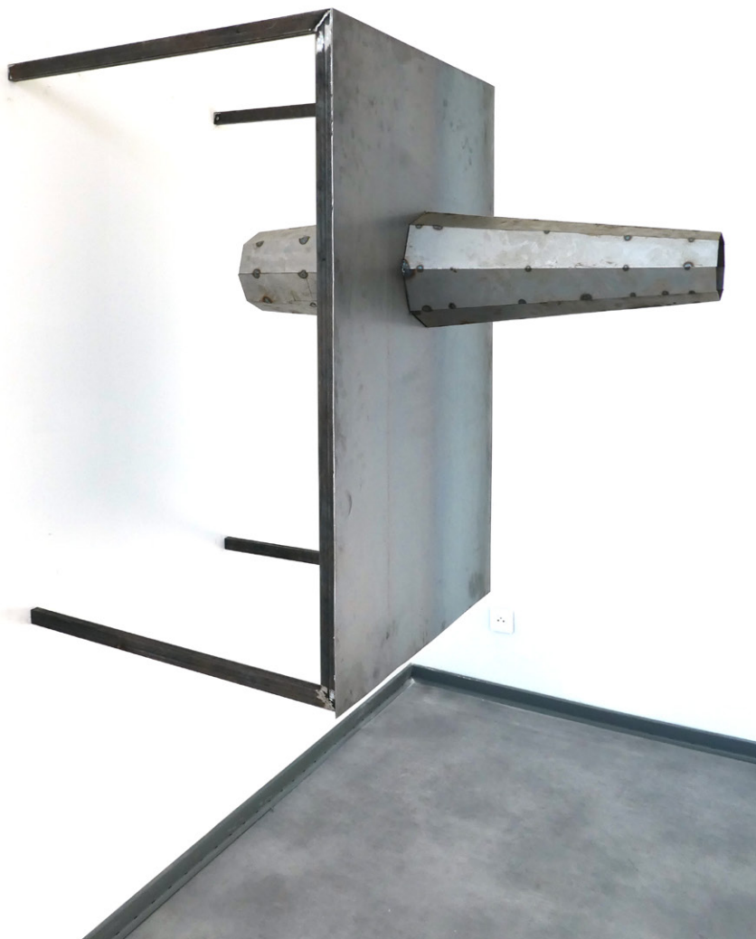
TABLE MURALE 1 & 2, 2022 Acier, 110 x 67 x 124cm