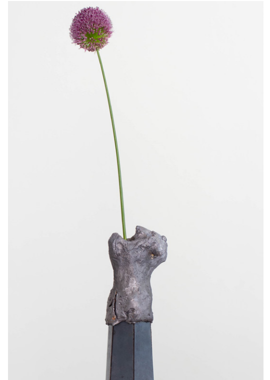
SANS-TITRE À LA FLEUR, 2023 Têtes en plomb, vase en acier, bloc de chêne, fleur Exposition Après-midi de chien , 2023, Chagny