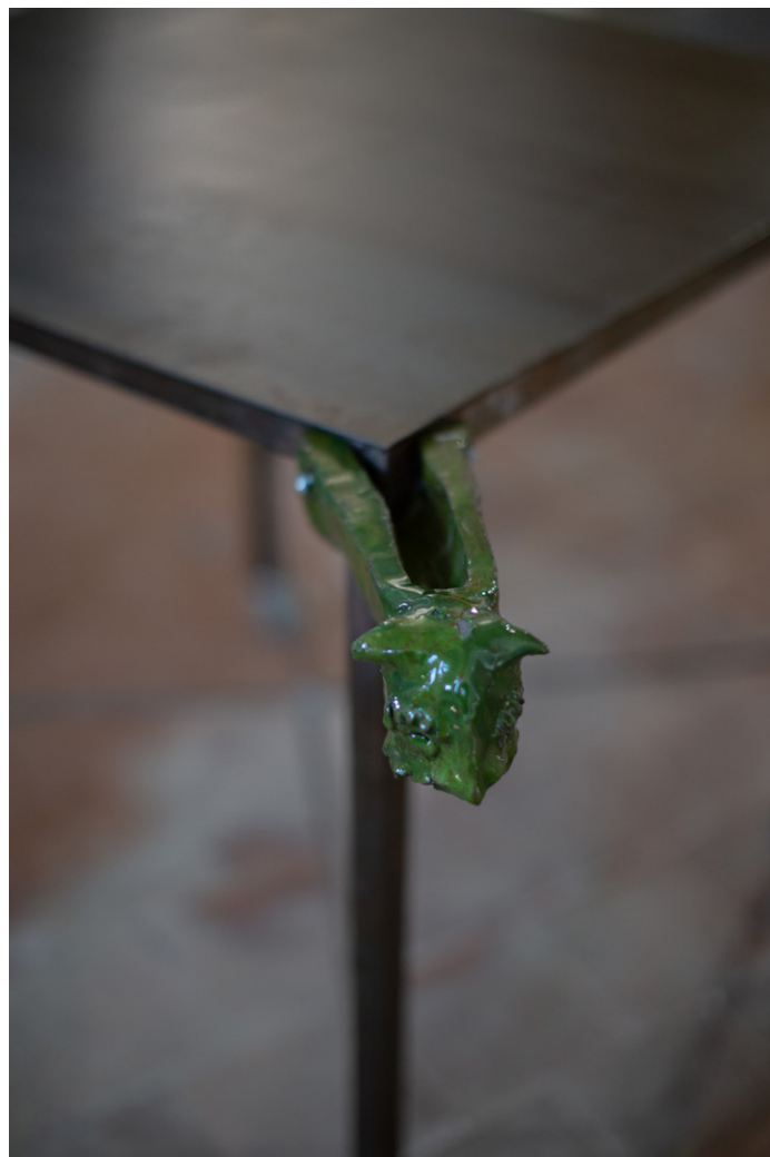
LES GARGOUILLES , 2023 Acier, Céramiques

Exposition Trois petits tours et puis s'en vont , 2023, église-musée St Nazaire, Bourbon-Lancy