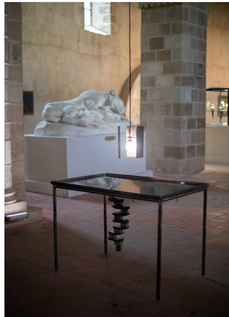
TABLE RASE , 2023

Acier, Vilebrequin de tracteur, huile moteur, ampoule, câble électrique