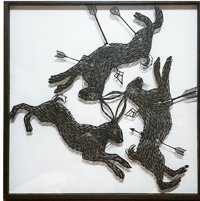
« Rats et Corbeaux », « les Trois lièvre », papiers découpés, 70x70cm