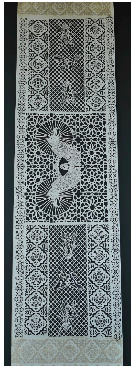
« Cuniculus #1 », papier découpé, 3x1m, 2019