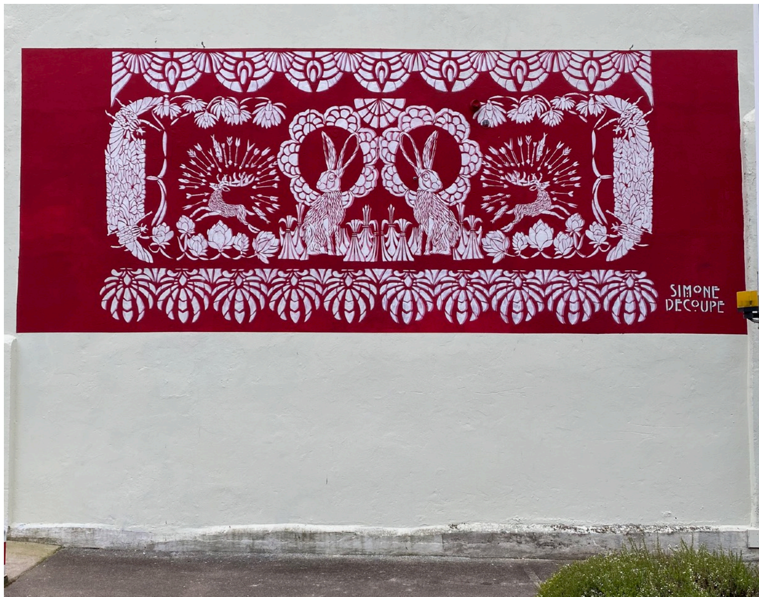
« Scène de chasse », pochoirs, 9x4m, Le MUR Vesoul, 2021