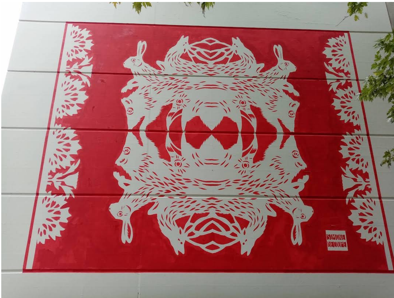
« Billebaude » fresque, pochoirs, 7x7m, 2023 Commande de Juste Ici, mur du CDN de Besançon