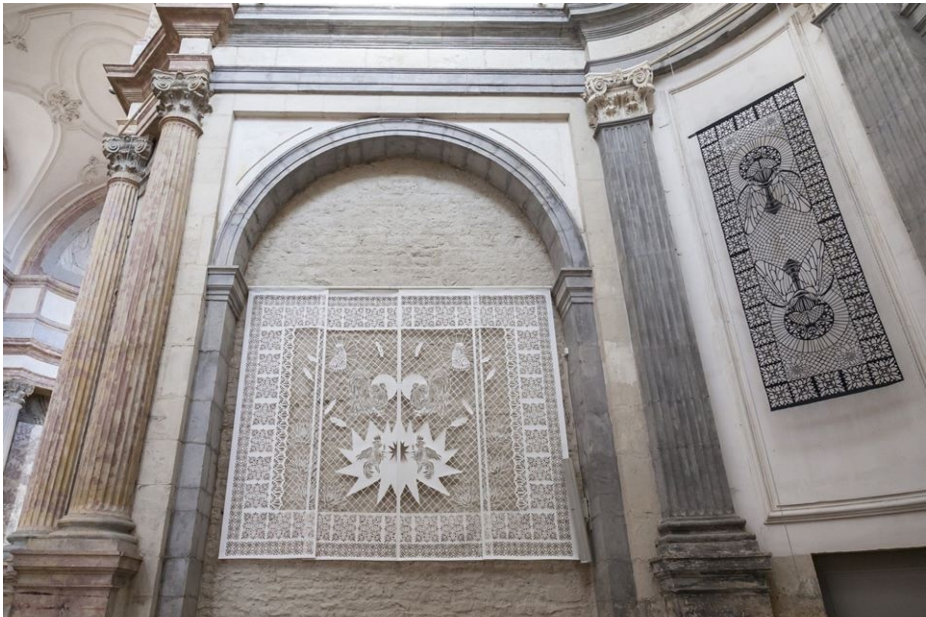
« Le Gallodrome », papier découpé, 4x3m, 2020 « La Mouche », papier découpé, 1x3m, 2020