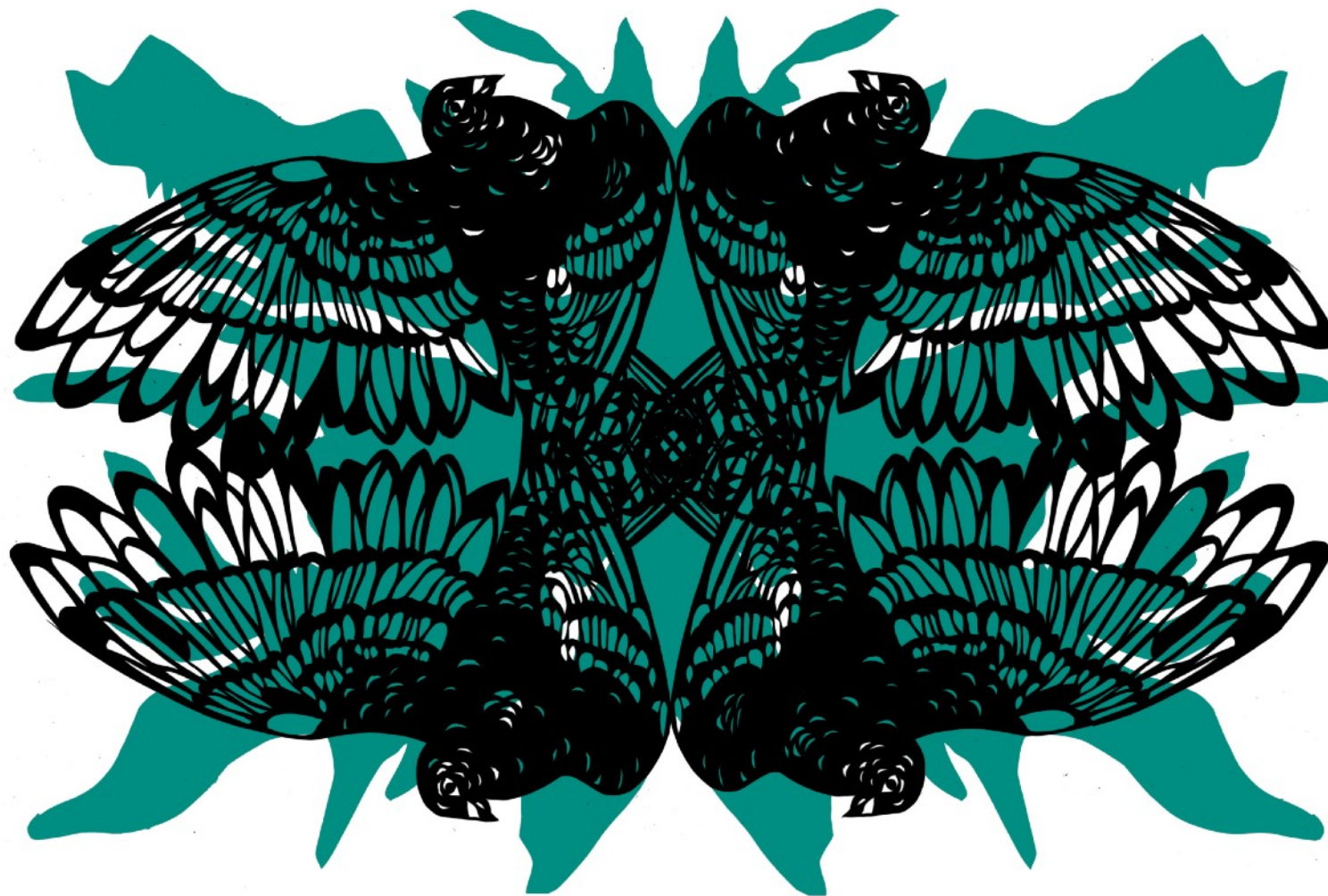
« Colombophilie », sérigraphie, deux couleurs, 70x50cm Projet à l'initiative de la Fondation Desperados, soutenu et imprimé par Juste Ici, 2021.