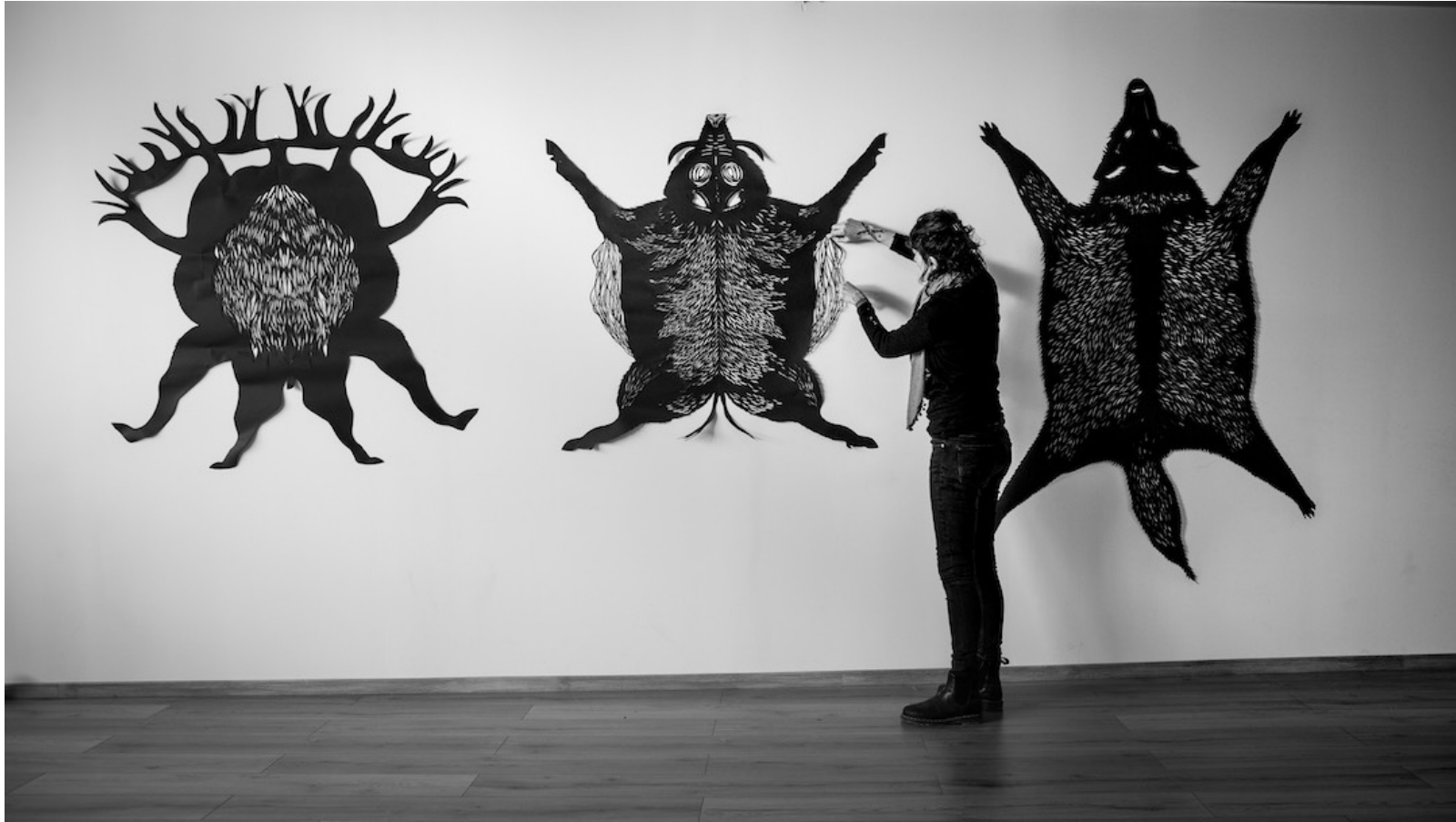
« Peaux », papier découpé, 2023