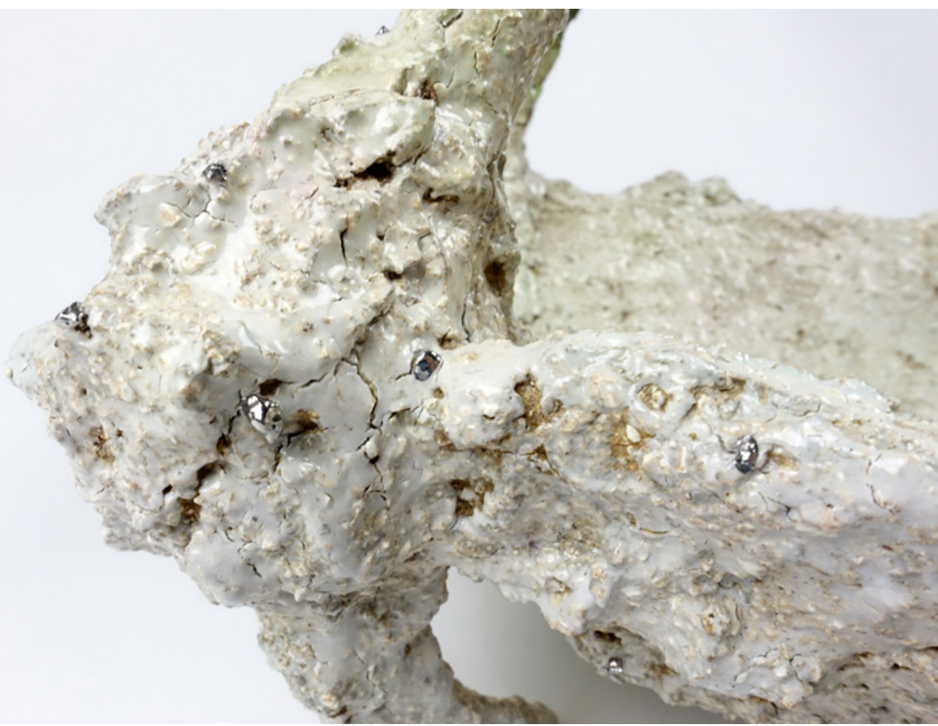
détail de Large ceremony dish