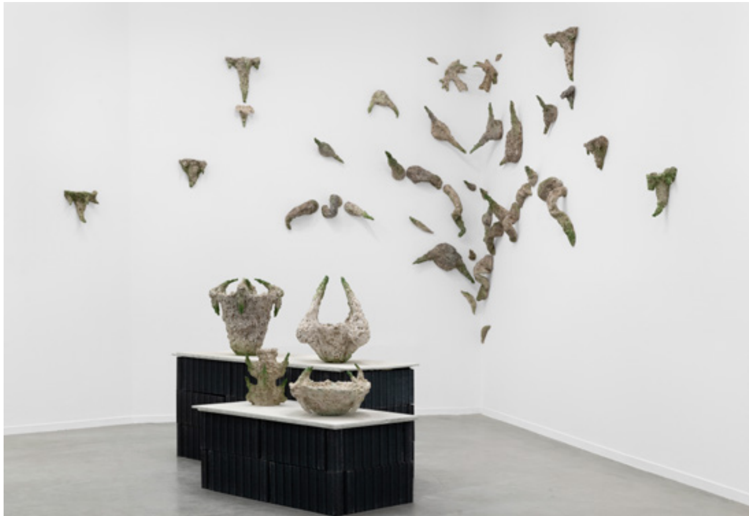
Vue d'exposition Le jardin des griffes

L'installation est composée d'un ensemble mural de ronces et de chandeliers, de 2 vasques et d'un chandelier. Elle s'inspire aussi bien de l'art de la rocaïlle, de la poterie Jommon que d'un film de SF. Les pièces sont très rugueuses et brutes mais ici ou là elles brillent de milles pépites d'argent.