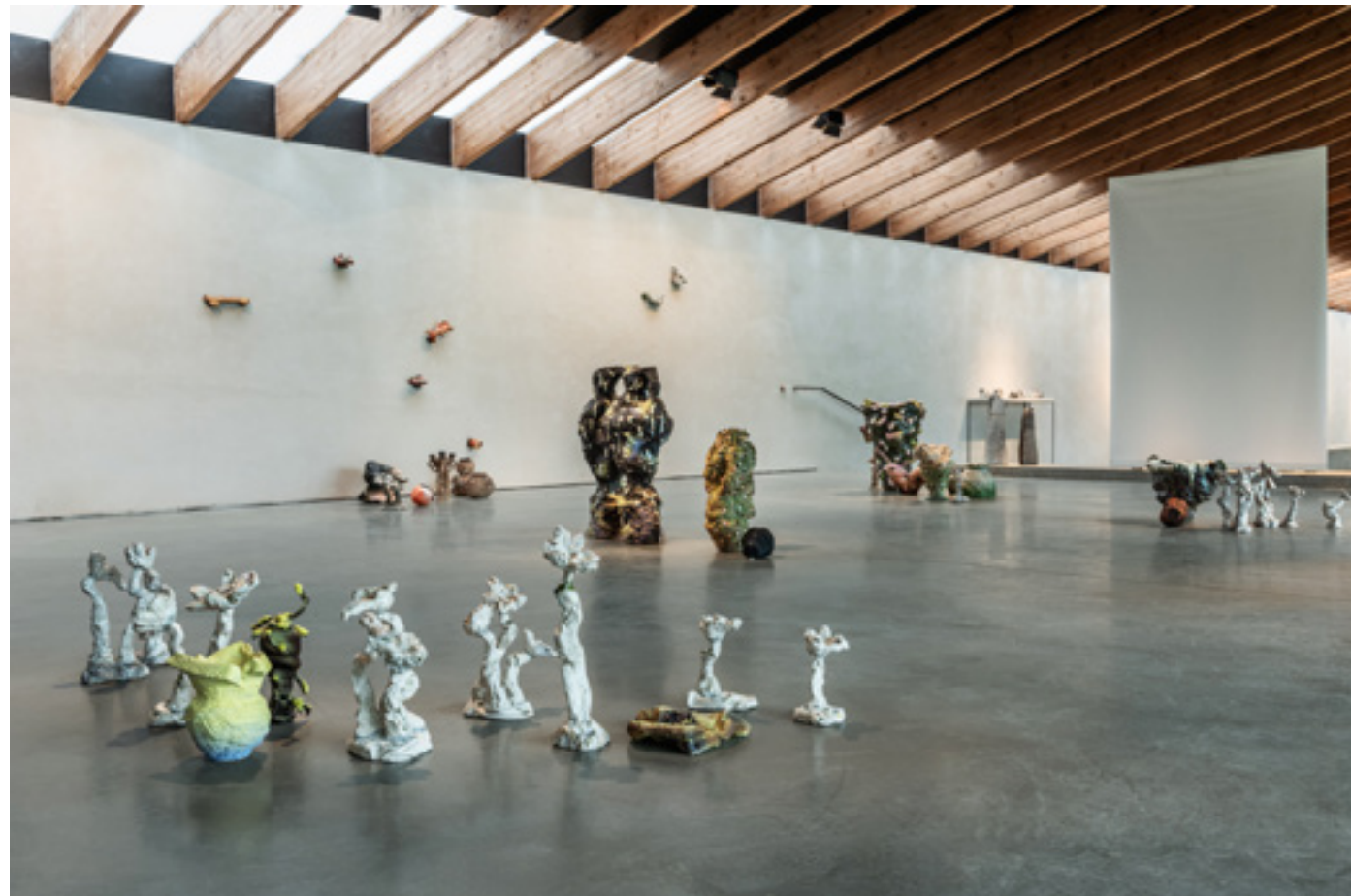
Vue d'exposition, Quelques pétales dans une rivière de pierres

Ces dernières pièces sont issues de recherches esthétiques et fantasmées sur le monde minéral et végétal. Roches cratères fraîchement tombées du ciel. Anciennes dinettes fossiles recouvertes de lichen. Protopoteries de granit dessinant les prémices du vide sur l'horizon. Les futurs cailloux se lovent côte à côte, rivière, ras de marrée ou rigaillou. En voilà quelques grains pour ceux qui aimeraient, les ramasser et les suçoter dans 10 000 ans.