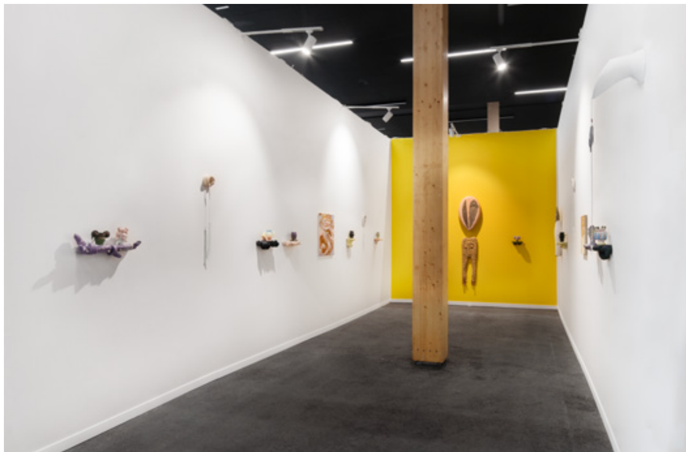
Vue d'exposition, BOOTH H. 13, Art Paris Art Fair

Pour cet évènement j'ai réalisé une série de petites pièces uniques, vases et sculptures en porcelaine. Elles étaient exposées sur des étagères en céramique aussi réalisées à 4 mains par le Duo Vertigo (Nitsa Meletopoulos + Victor Alarcon)