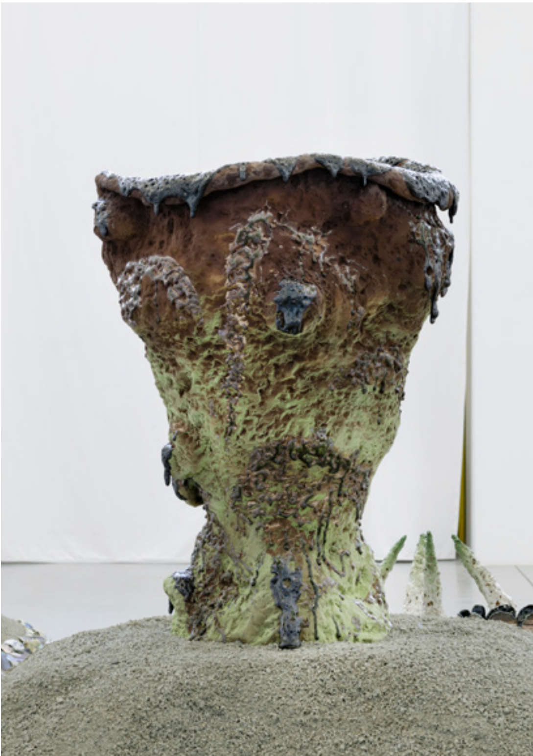
page suivante : Crater , 2023 grès engobe, émail H79 x 60 x 60 cm