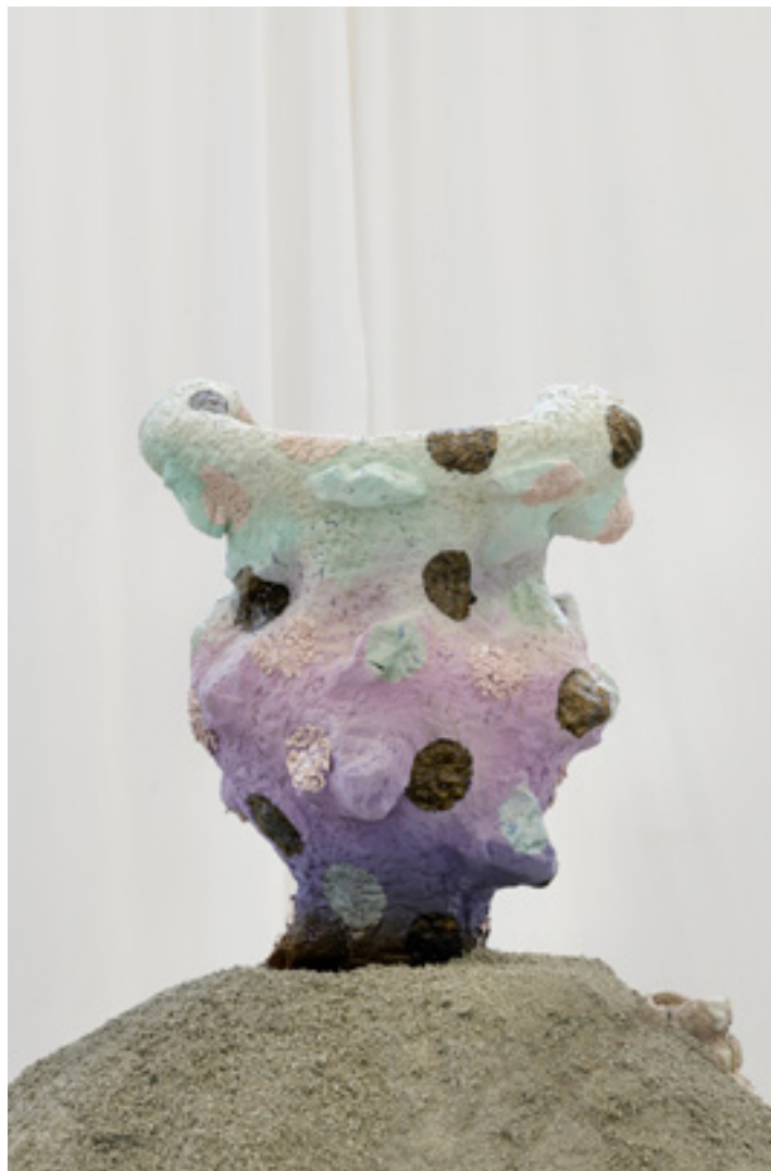
Moss and melt, 2023 grès engobe, émail, brique réfractaire, porcelaine H58 x 32 x 21 cm, photographie Ludovic Combes