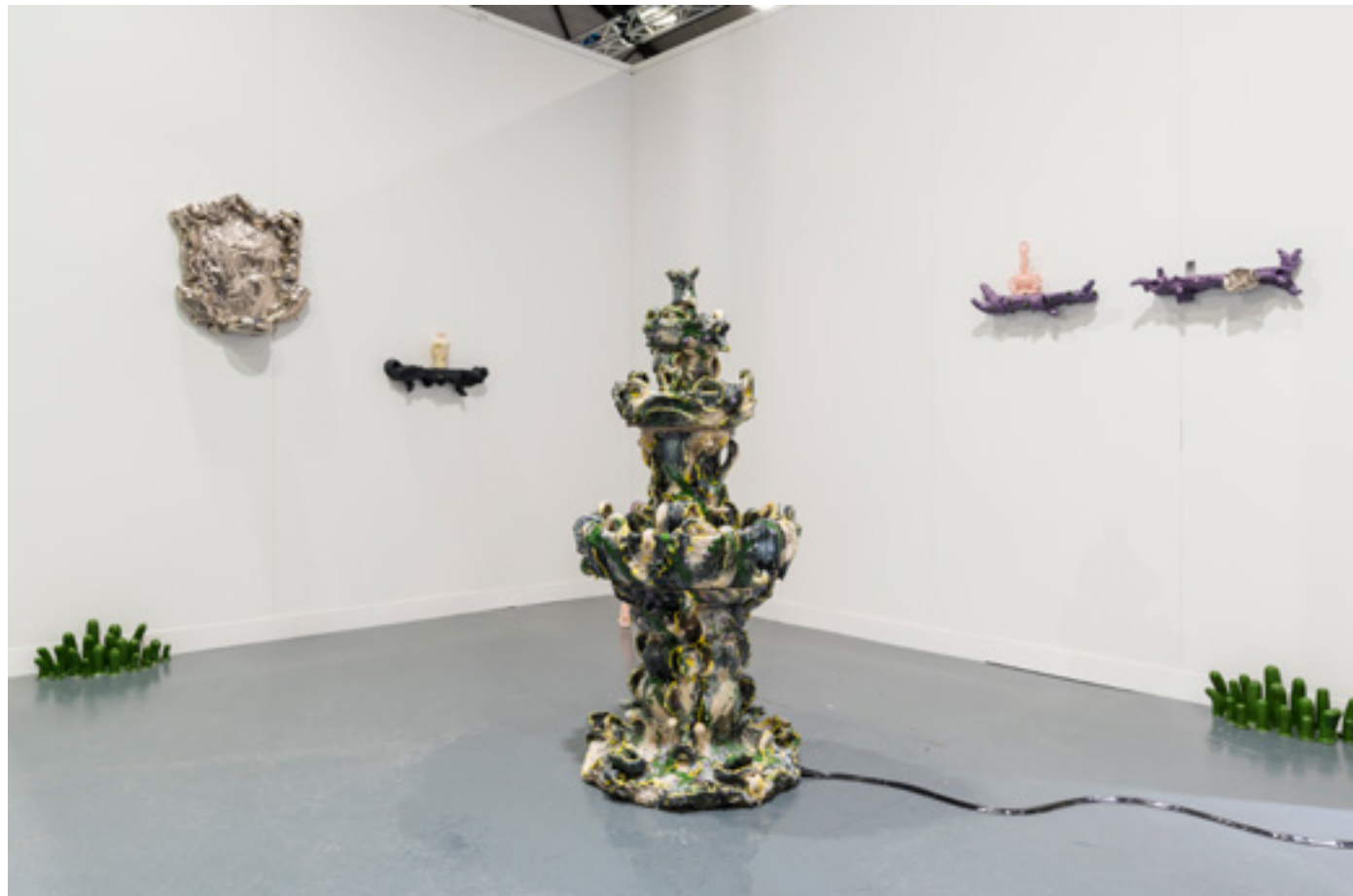
Exhibition view, CERAMIC BRUSSELS ART PRICE

Duo Vertigo est un projet qui a débuté en 2020 entre Nitsa Meletopoulos et Victor Alarcon. Réalisées à 4 mains et 2 cerveaux les pièces du duo Vertigo parlent de céramique, de l'amour, du désir, du sexe mais aussi du désenchantement. Vertigo est le vertige que vous pouvez ressentir lorsque vous découvrez quelque chose de nouveau et d'excitant, lorsque vous tombez amoureux, lorsque vous avez peur. Duo Vertigo crée des pièces de design colorées et gloopy mêlant poterie traditionnelle et contemporaine. Vertigo est romantique mais sale, Duo Vertigo fait des choses que vous pouvez utiliser: fioles de philtres d'amour, godes touffes d'herbe, miroirs flous, grands lustres dégoulinants, tabourets de vermicelles de sperme rose, étagères ronces inspirées par Peau d'âne. Globalement Vertigo est ludique, joyeux et coloré avec une pointe d'obscénité au quotidien.