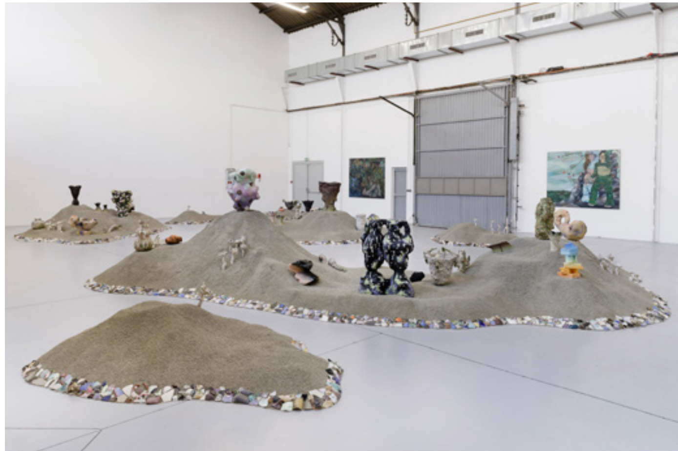
Exhibition view, Stones smell good when you cuddle them

Ça bouillonne de feu maintenant, des minéraux mous sous l'effet du choc. C'est souvent comme ça que se fabriquent les pierres, avec d'autres pierres. Roches, vaisseaux, potiches.. Et il reste les grands creux le bord des lèvres brûlants, les trou-trous la panse vernissée. Les premiers vases cratère remplis, gorgés du bouillon, de la mixture glouglou là où pullule le ciment carboné. La boue vibrante enlumine les lichens et les fentes. Elle distribue les acides et fait mousser les granites. Puis dans le froid sec, crac, tout part en éclats, petits cailloux, tessons, poussières. La dînette cosmique se love dans les recoins, les plis des failles chaudes, à nourrir d'autres verres ; les pierres que suçotent ceux qui ruminent et boivent.