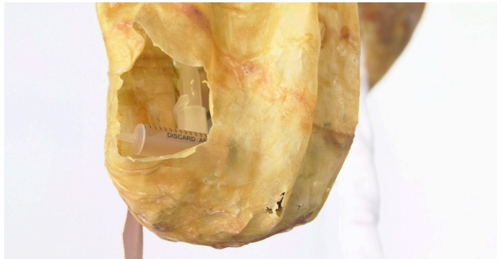
CONDOMS OR CHRYSALIS, LATEX, TEXTILES, PLATRES, ENCRE, OBJETS MANUFACTURÉS, DIMENSIONS VARIABLES, 2022