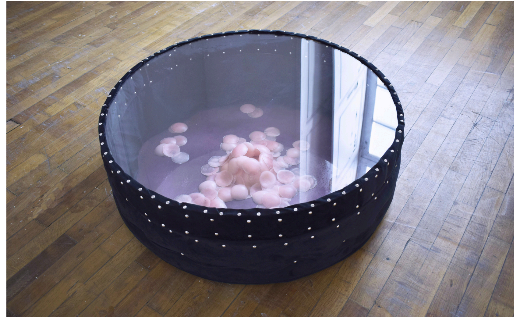
UNDOMESTICATED BOX, TECHNIQUES MIXTES, 100X50 CM, 2023