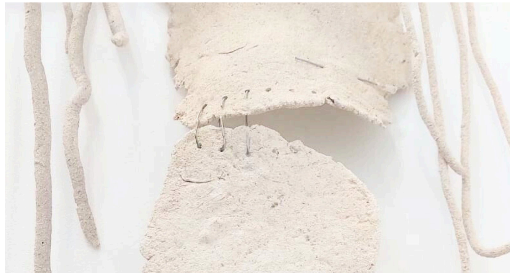
WET WIPE, BIOCÉRAMIQUE, SEL D'ALUN, PORTE-SERVIETTE, AIGUILLE À SERINGUE, ÉTAING, DIMENSIONS VARIABLES, 2025