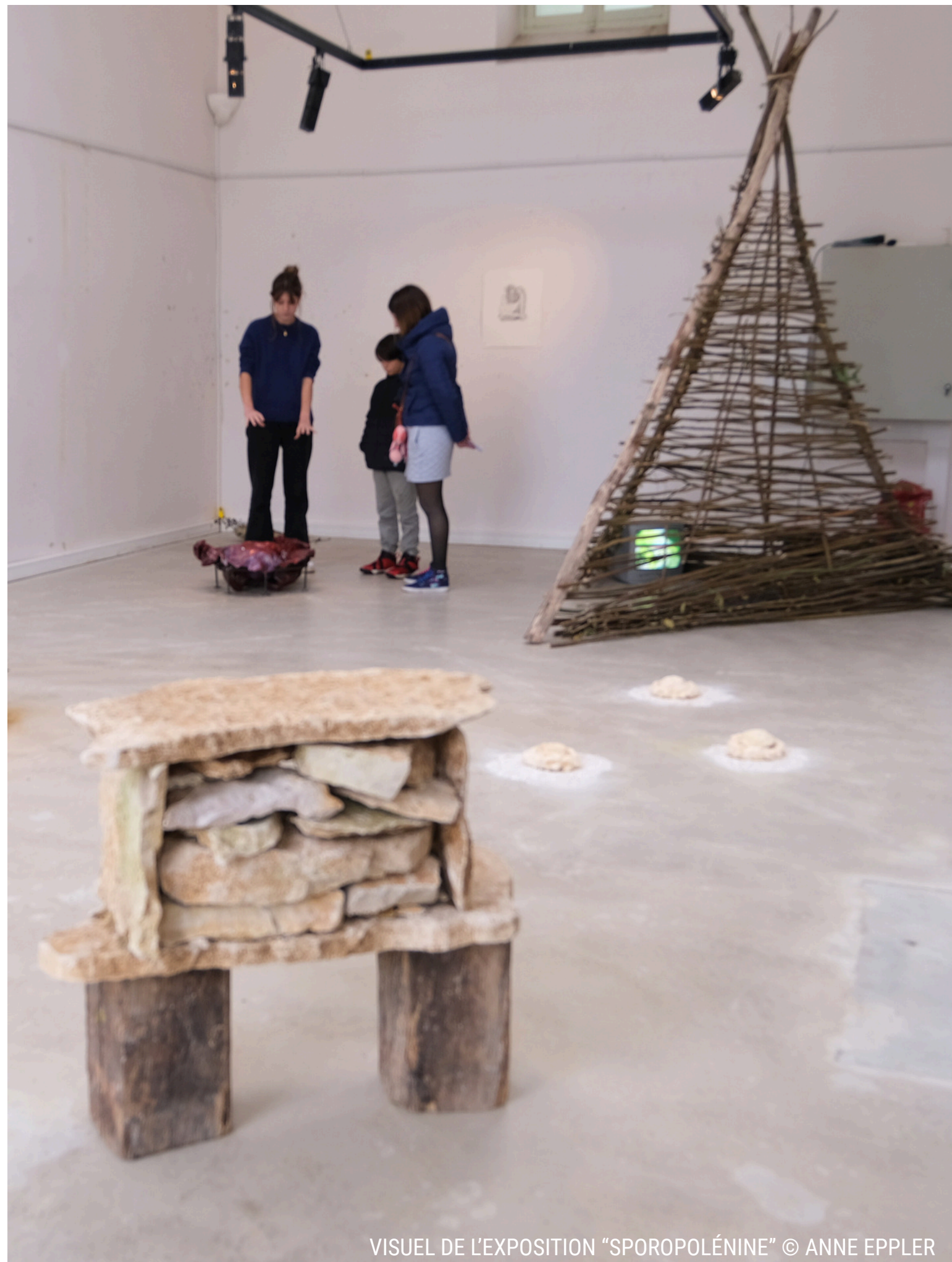
VISUEL DE L'EXPOSITION "SPOROPOLÉNINE" © ANNE EPPLER