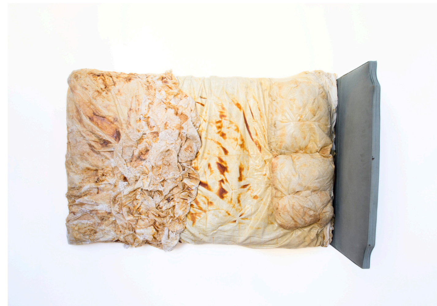
THE BED, LIT, TEXTILES, LATEX, 180X160X100CM, 2020