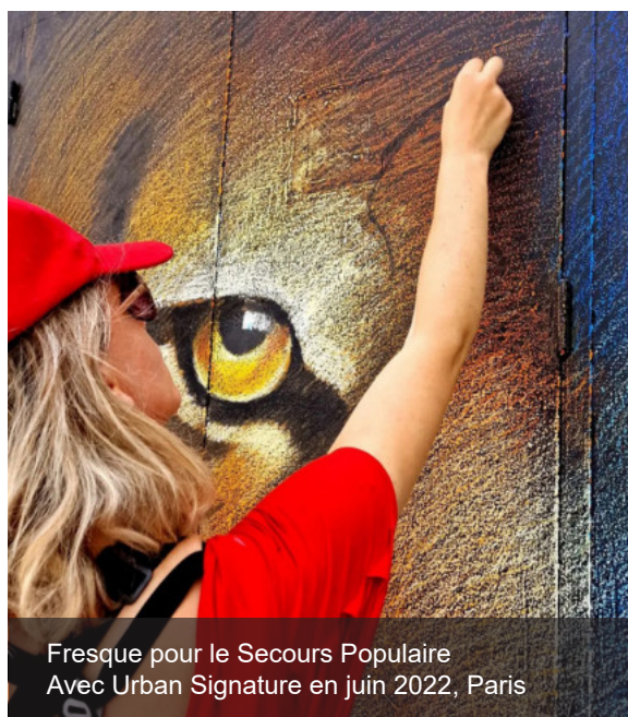
Fresque pour le Secours Populaire Avec Urban Signature en juin 2022, Paris