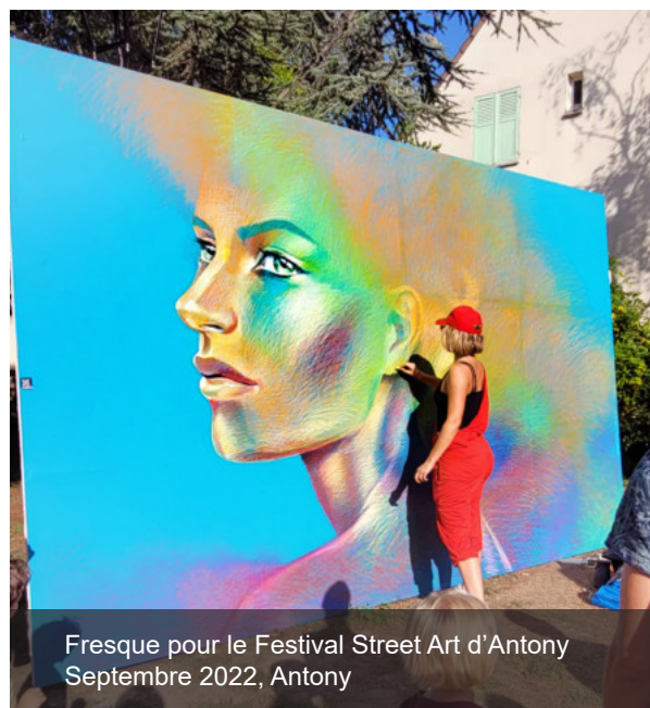
Fresque pour le Festival Street Art d'Antony Septembre 2022, Antony