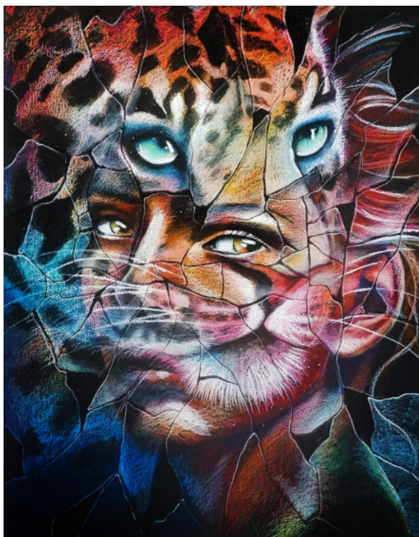
Tableau « Métamorphose » 170 x 1200 cm Pastels à l'huile, 2020