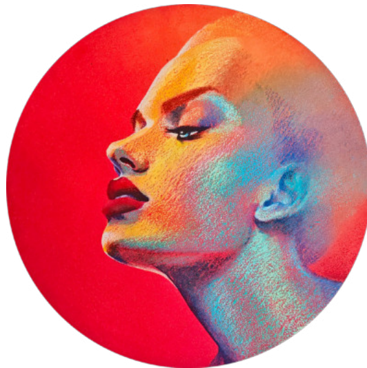
Tableau « Sunlight » 40 cm de diamètre Pastels à l'huile, 2024

À travers cette approche, la couleur ne se limite pas à un simple choix esthétique : elle traduit des états intérieurs, des élans de liberté et une volonté de transmettre une énergie positive et accessible à tous.