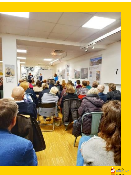
Vernissage de l'exposition Gustave Eiffel à la Maison de Bourgogne-Franche-Comté

Sa mission consiste à resserrer les liens d'amitiés et à promouvoir les coopérations dans les domaines de la culture, du tourisme, de l'éducation, de la jeunesse, et de l'économie. Elle facilite ainsi la mise en relation entre les Bourguignons-Francis-Comtois et les Rhéno-Palatins, au plus près des territoires, et constitue le point de rencontre privilégié des différents acteurs.