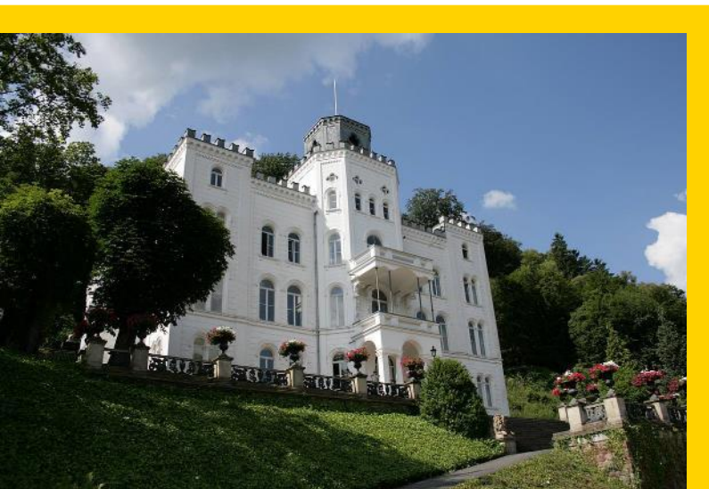
Le château de Balmoral

L'Artist residency Schloss Balmoral est une institution de la Fondation de Rhénanie-Palatinat pour la culture et attribue des bourses à des artistes du monde entier pour promouvoir les arts visuels contemporains.