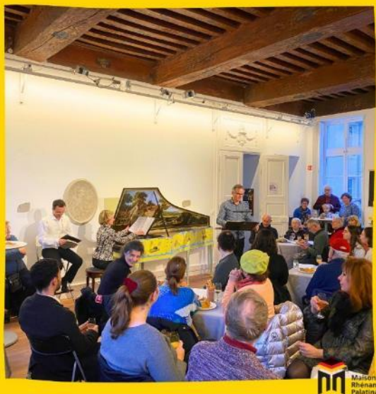
Concert « Bach au bistrot » à la Maison Rhénanie-Palatinat

La mission de la Maison de Rhénanie-Palatinat est de renforcer l'amitié franco-allemande et de promouvoir la coopération entre la Bourgogne-Franche-Comté et la Rhénanie-Palatinat et entre la France et l'Allemagne. http://maison-rhenanie-palatinat.org/