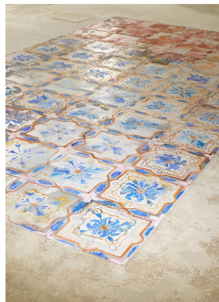
MATHILDE NOIR - Coule la pluie - 2025 - Gouache sur carrelage - 240x240 © Noir Mathilde

Mes pièces naissent souvent par fragmentation : réminiscences d'un ensemble. »