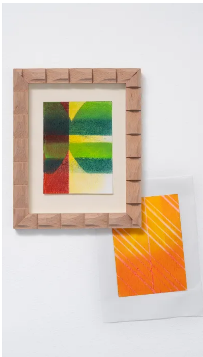
CÉLINE NOTHEAUX, The diamond shape skyline , 2025 - Exposition - 23 mai - 15 juin, Atelier Vauban, Besançon

Céline Notheaux est diplômée de l'Institut Supérieur des Beaux-Arts de Besançon et de l'Universitat de Bellas Artes de Valencia.