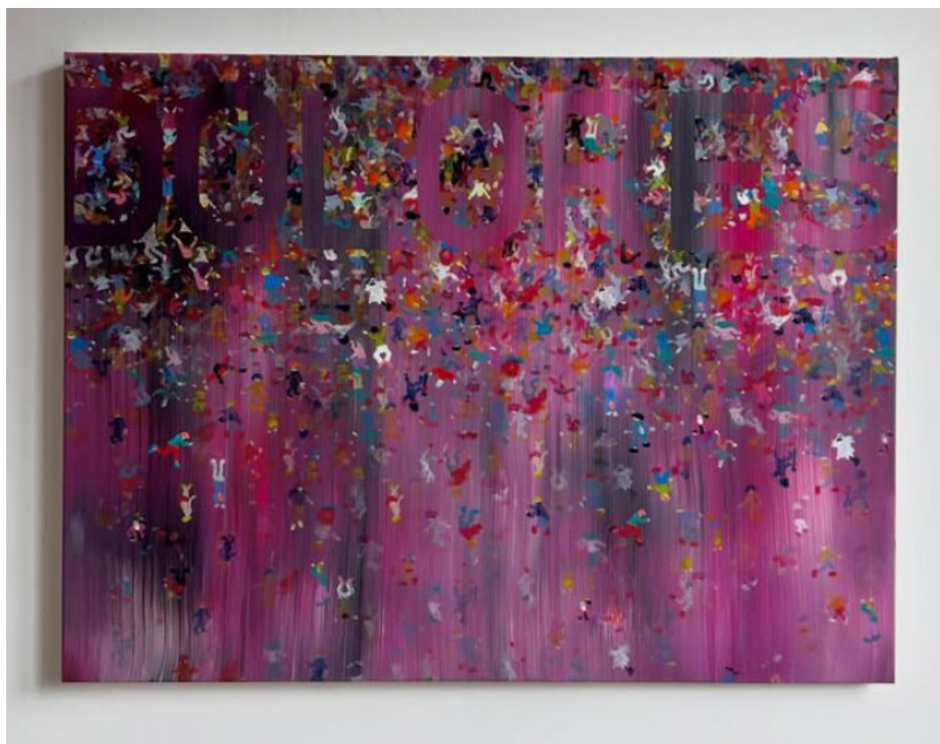
IVAN FAYARD, DOLORÈS - 2026, oil and acrylic on canvas 75x100cm © Ivan Fayard / ADAGP, Paris 2026

En s'interrogeant sur ces questions de l'assimilation, de la mémoire, d'un vécu spécifique, on entrevoit dans sa pratique artistique une interrogation troublante constituée de masques derrière lesquels il pourrait se cacher, sorte d'identités artistiques inventées.