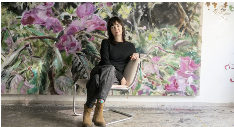
TANJA SELZER

Ses peintures en technique mixte semblent autant être des moments instantanés que des rêves. Dans ses œuvres, l'artiste explore les limites du voyeurisme et ses conséquences sociales. Des éléments en apparence incohérents sont combinés comme des séquences d'une narration; ce sont des situations ordinaires, mais elles éludent constamment la causalité et la logique.